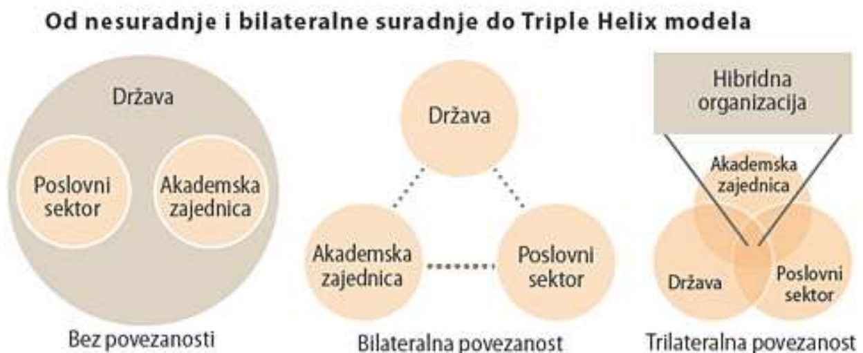
Slika 1: Od nesuradnje i bilateralne suradnje do Triple Helix modela