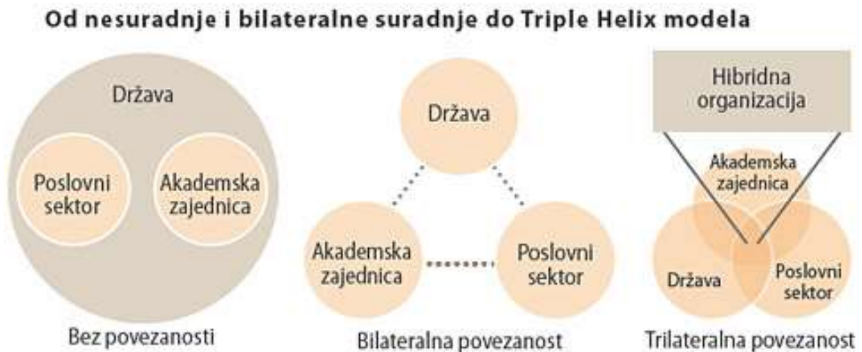
Slika 1: Od nesuradnje i bilateralne suradnje do Triple Helix modela