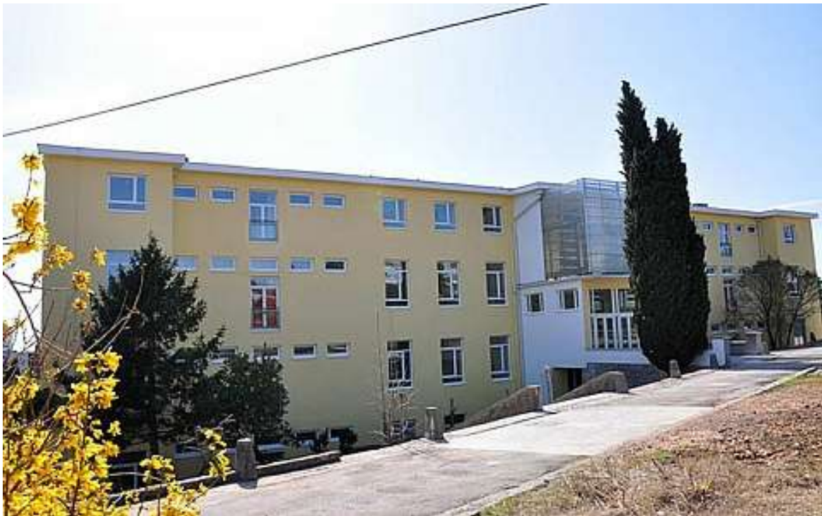
Slika 4: Step Ri znanstveno-tehnološki park Sveučilišta u Rijeci