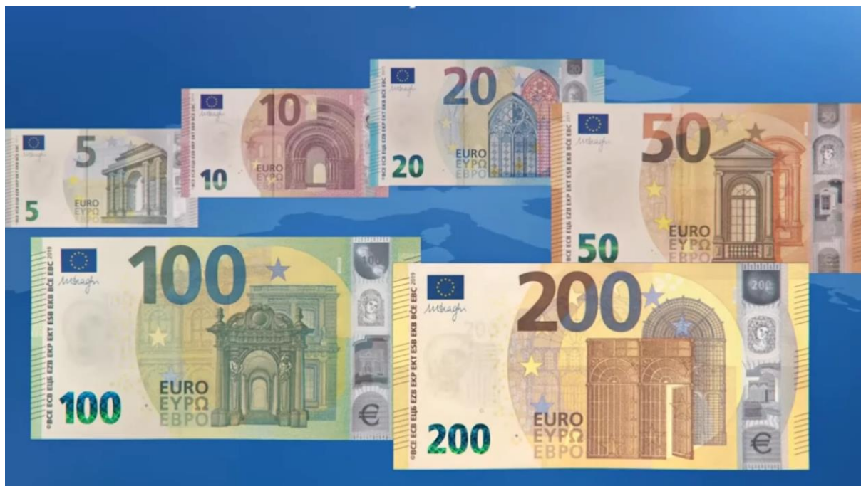
Slika 4. Novčanice eura [pristupljeno 14.6.2020.]

Prema publikaciji Europske komisije Euro (€) dijeli 19 članica od ukupno 28 i jedinstvena je za Europsku Uniju. U početku se koristio samo za bezgotovinsko plaćanje, a od 2002. godine su izdane prve novčanice i kovanice koje se koriste za sva plaćanja. Euro se u pojedinu državu članicu uvodi tek ispunjenjem određenih kriterija koji su propisani ugovorom iz Maastrichta, a odnose se na stabilnost cijena, javne financije, tečaj i dugoročne kamatne stope. „Država članica EU-a mora dobiti pozitivnu ocjenu institucija EU-a – Europske središnje banke i Europske komisije – o ispunjavanju kriterija i spremnosti za nesmetano funkcioniranje u monetarnoj uniji. Jedan od kriterija – onaj o stabilnosti tečaja, koji podrazumijeva da nacionalna valuta države članice sudjeluje u tečajnom mehanizmu ERM II bez poremećaja i velikih oscilacija tečaja u odnosu na euro najmanje dvije godine – uvjetuje ukupnu dinamiku procesa uvođenja eura.“ (Hrvatska narodna banka, mrežno izdanje, 2017.)