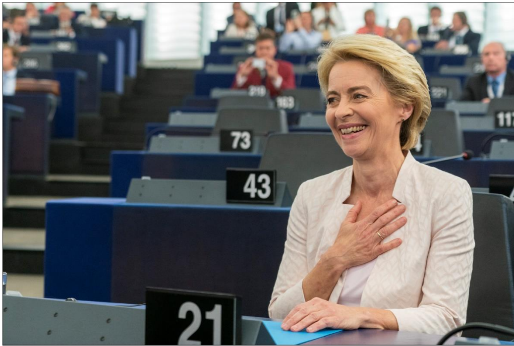
Slika 1. Ursula von der Leyen ( https://www.europarl.europa.eu ) [pristupljeno 14.6.2020.]