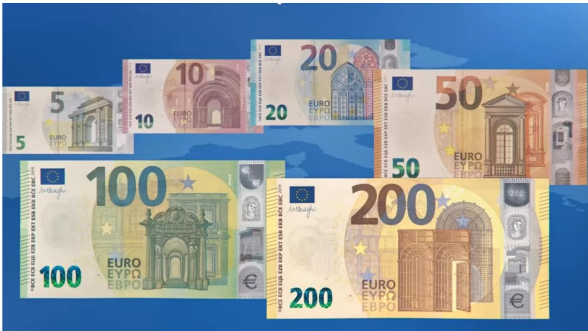
Slika 4. Novčanice eura

Prema publikaciji Europske komisije Euro (€) dijeli 19 članica od ukupno 28 i jedinstvena je za Europsku Uniju. U početku se koristio samo za bezgotovinsko plaćanje, a od 2002. godine su izdane prve novčanice i kovanice koje se koriste za sva plaćanja. Euro se u pojedinu državu članicu uvodi tek ispunjenjem određenih kriterija koji su propisani ugovorom iz Maastrichta, a odnose se na stabilnost cijena, javne financije, tečaj i dugoročne kamatne stope. „Država članica EU-a mora dobiti pozitivnu ocjenu institucija EU-a – Europske središnje banke i Europske komisije – o ispunjavanju kriterija i spremnosti za nesmetano funkcioniranje u monetarnoj uniji. Jedan od kriterija – onaj o stabilnosti tečaja, koji podrazumijeva da nacionalna valuta države članice sudjeluje u tečajnom mehanizmu ERM II bez poremećaja i velikih oscilacija tečaja u odnosu na euro najmanje dvije godine – uvjetuje ukupnu dinamiku procesa uvođenja eura.“ (Hrvatska narodna banka, mrežno izdanje, 2017.)