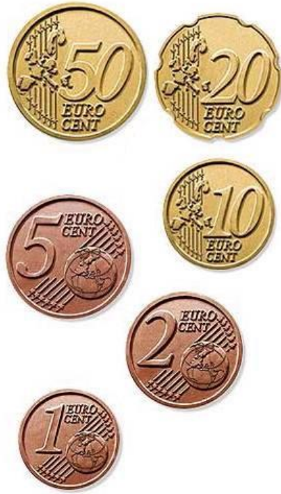
Slika 5. Kovanice eura [pristupljeno 14.6.2020.]