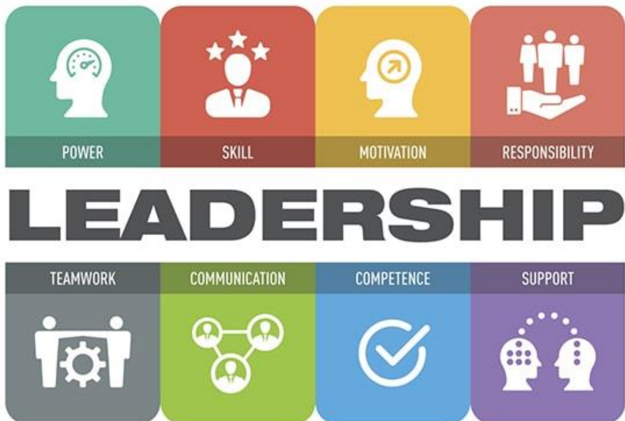
Slika 5.: Komponente liderskih metoda

Izvor: https://www.smallbusinesspro.co.uk/marketing/leadership-styles.html (25.10.2019)