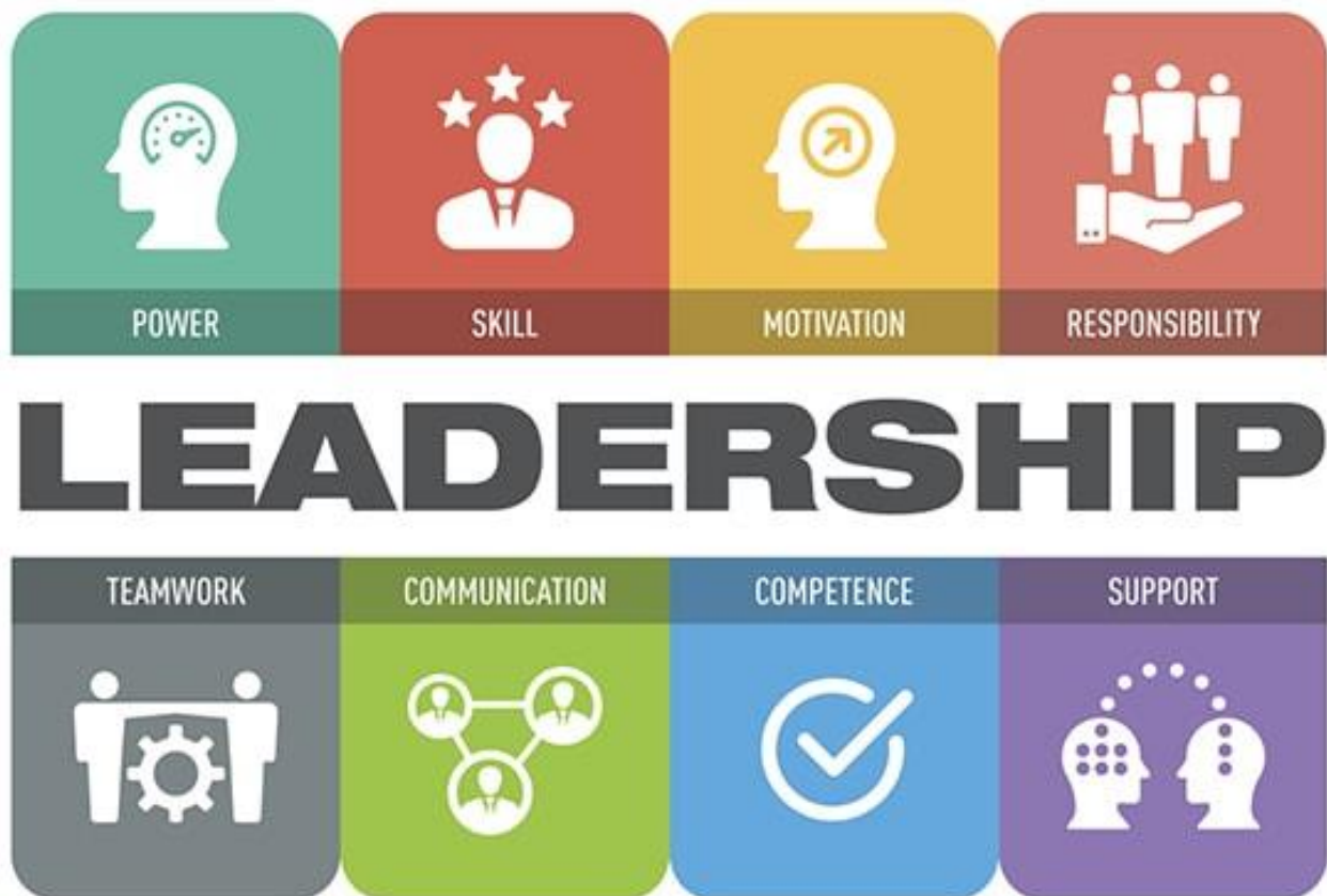
Slika 5.: Komponente liderskih metoda