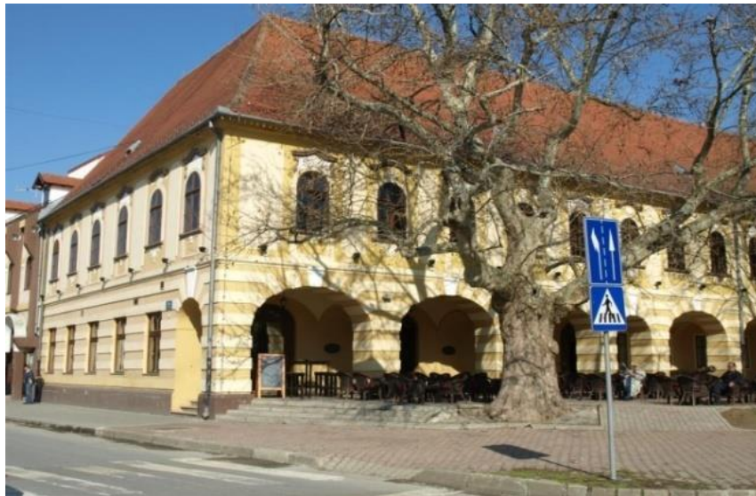
Slika 1. Zgrada muzeja

U Vinkovcima se prvi puta serijski proizvode bakrene sjekire, pronađena je i najstarija keramička peć. Pronađeni su i slavenski grobovi iz 7. stoljeća, a iz razdoblja Osmanlijskog carstva ostao je poseban barokni stil. Zgrada muzeja iz 1785. godine najljepši je i najveći barokni spomenik u Vinkovcima.