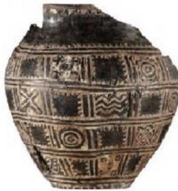
Slika 2. Orion