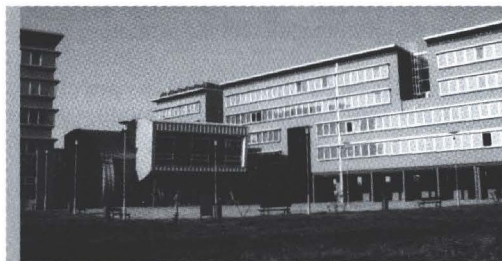
Novi studentski dom u Osijeku

Isto tako je neophodno istaknuti da se u Studentskom centru nalazi i Osječki klub studenata (OKS), te brojni prostori (kazališna, kongresna dvorana i dr.).