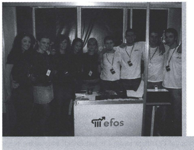
Vaš Studentski zbor EFO

Ekonomski fakultet u Osijeku je četiri i pol desetljeća star fakultet, a starost donosi iskustvo, iskustvo koje se prenosi na studente Ekonomskog fakulteta u Osijeku. Stoga, dođite i uvjerite se da je Ekonomski fakultet u Osijeku Vaš najbolji izbor, a mi ćemo Vam reći, jezikom ekonomista - što, kako i za koga - učite?