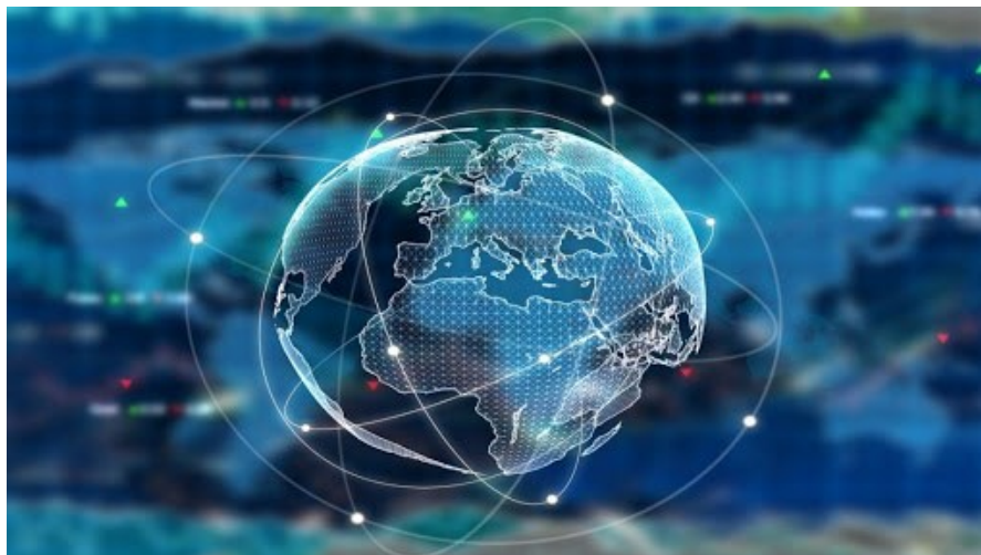
Slika 1. Globalizacija i jedinstvenost svijeta ( http://www.dku.efst.hr/drustveno-korisno-ucenje-u-svjetlu-globalizacije-2-dio/ )

prenoseći kapital ili resurse iz jedne zemlje u drugu, utječući na (ne)zaposlenost milijuna ljudi i stupanj ekonomske aktivnosti u pojedinim državama. 17