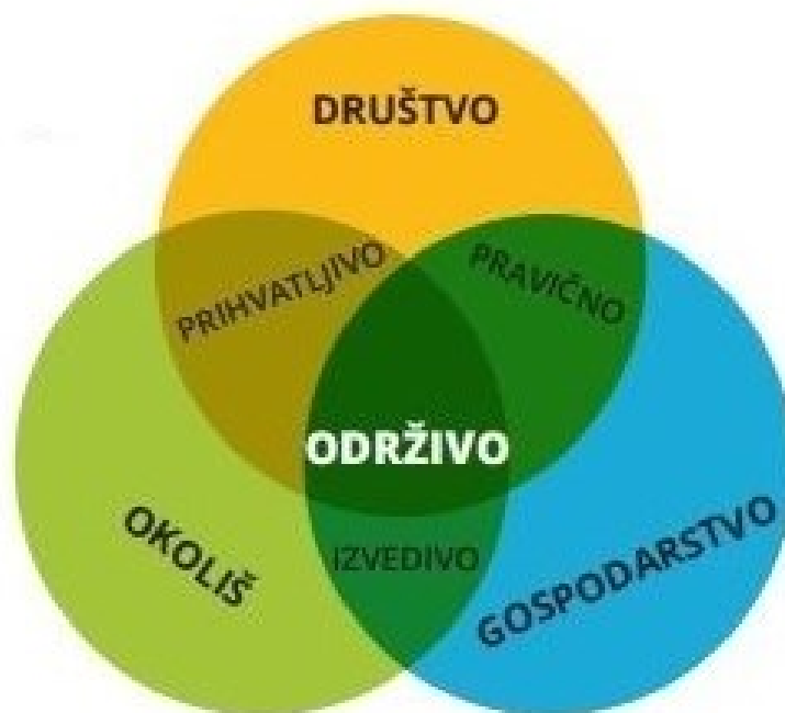
Slika 3. Primjer održivog razvoja ( http://www.odraz.hr/hr/nase-teme/odrzivi-razvoj )

Održivi razvoj je okvir za oblikovanje politika i strategija kontinuiranog gospodarskog i socijalnog napretka, bez štete za okoliš i prirodne izvore bitne za ljudske djelatnosti u budućnosti. On se oslanja na ambicioznu ideju prema kojoj razvoj ne smije ugrožavati budućnost dolazećih naraštaja trošenjem neobnovljivih izvora i dugoročnim devastiranjem i zagađivanjem okoliša. Osnovni je cilj osigurati održivo korištenje prirodnih izvora na nacionalnoj i međunarodnoj razini. 38