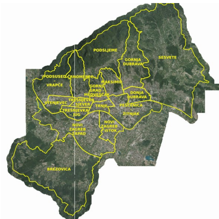
Slika 2. Prostorni prikaz grad Zagreba ( https://geoportal.zagreb.hr/Karta )

svijest javnosti o potrebi brige za okoliš. 29 Kroz analizu također su utvrđene i brojne prilike za kvalitetniji razvoj: korištenje EU fondova i drugih inozemnih financijskih izvora za razvoj malog i srednjeg poduzetništva, bolji pristup tržištu proizvoda i usluga ulaskom u EU, geoprometni i geopolitički položaj kao resurs za razvoj, razvijanje i povezivanje ruralnog prostora kao poljoprivrednog, ekološkog, krajobraznog i turističkog potencijala u područje Grada, djelotvornija suradnja sa susjednim županijama u zaštiti okoliša i prirodnih vrijednosti, uključivanje u fondove potpore i proširivanje tržišta za ekološku proizvodnju, agroturizam, ruralno kulturni krajobraz. Na kraju dolazimo do završetka SWOT analize gdje su prepoznate određene prijetnje za tri područja. Konkurencija drugih europskih gradova u tržišnom natjecanju, siva ekonomija, gubitak identiteta povijesnih naselja, pritisci za prenamjenu poljoprivrednog prostora, klimatske promjene, ugroženost podzemnih voda su prijetnje koje mogu stati na kraj razvoju Zagreba ako ih se ne kontrolira i sanira u određeno vrijeme.