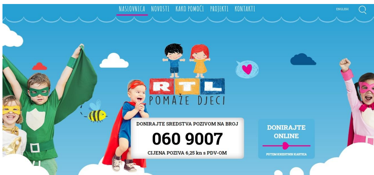
Slika 1. Web stranica udruge "RTL pomaže djeci"

Udruga „RTL pomaže djeci“ koristi razne komunikacijske kanale pomoću kojih provodi svoje marketinške aktivnosti. Primarno, komunikacijski je kanal službena web stranica putem koje svi zainteresirani za prijavu svojih projekata, donacije u sklopu projekata te željne informacije o radu Udruge mogu pristupiti.