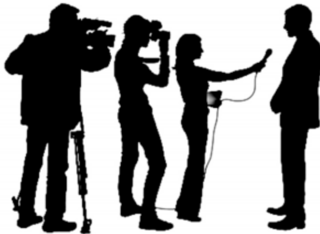
Slika 7. Ilustracija odnosa s javnošću

„Odnosi s javnošću društvena su znanost koja analizira trendove, predviđa njihove posljedice, savjetuje menadžere i provodi planirane programe akcija sa svrhom da služe organizacijskomu i javnom interesu. Praktičari odnosa s javnošću planiraju, uspostavljaju i održavaju dobar glas te međusobno razumijevanje između organizacije i njezinih javnosti. Neki autori smatraju da su odnosi s javnošću istovjetni propagandi“ (Šutalo, 2017:8).