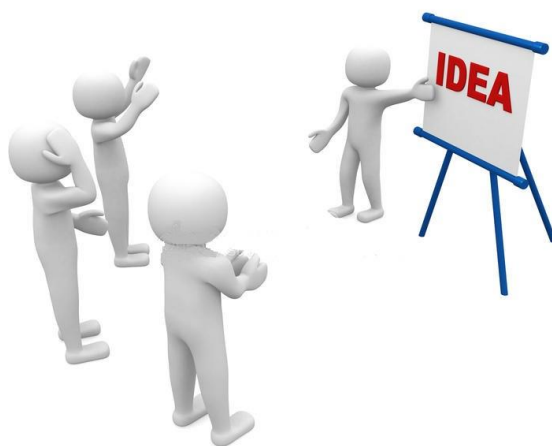
Slika 4. Javno izlaganje

Javno izlaganje – Izlaganje tj. prezentacija treba biti prilagođena publici kojoj je namijenjena. Prezentiranje možemo održati pomoću audiovizualnih pomagala poput PowerPoint prezentacije na računalima, plakata, izložbi ili videozapisa. Bitno je da izlagač bude pripremljen i susretljiv prema slušateljima, koristi lako razumljiv govor i obraća se direktno slušateljima. Prilikom izlaganja važno je paziti na govor tijela i pratiti reakciju slušatelja jer ona može biti od velike koristi kod prenošenja informacija. Da bi se uspostavila komunikacija između izlagača i slušatelja poželjno je ponuditi zanimljive tiskane materijale s korisnim informacijama te na kraju izlaganja odvojiti malo vremena za pitanja i komentare.