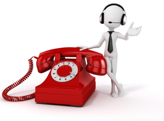
Slika 3. Komunikacija putem telefona