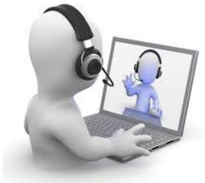
Slika 5. Video konferencija

Video konferencija – Video konferencija je način komunikacije u kojem se zvuk i slika u pokretu prikazuju na dvije ili više lokacije istovremeno. Za video konferenciju potrebna su tri ili više sudionika s opremom potrebnom za održavanje iste. Video konferencije se većinom upotrebljavaju u poslovne svrhe, ali moguće je i održavanje nastave ili učenja na daljinu. Ovakav način komunikacije omogućuje istovremeno sudjelovanje na sastanku osobama koje se nalaze na različitim mjestima, a prednost joj je što je vezana za rad od kuće.