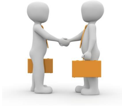
Slika 2. Komunikacija licem u lice

komunikacije usko je vezana uz neverbalnu komunikaciju koja dodatno doprinosi izražavanju emocija i naglašavanju bitnih dijelova razgovora.