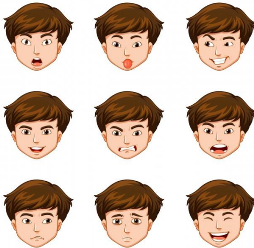
Slika 6. Neverbalna komunikacija – mimika lica