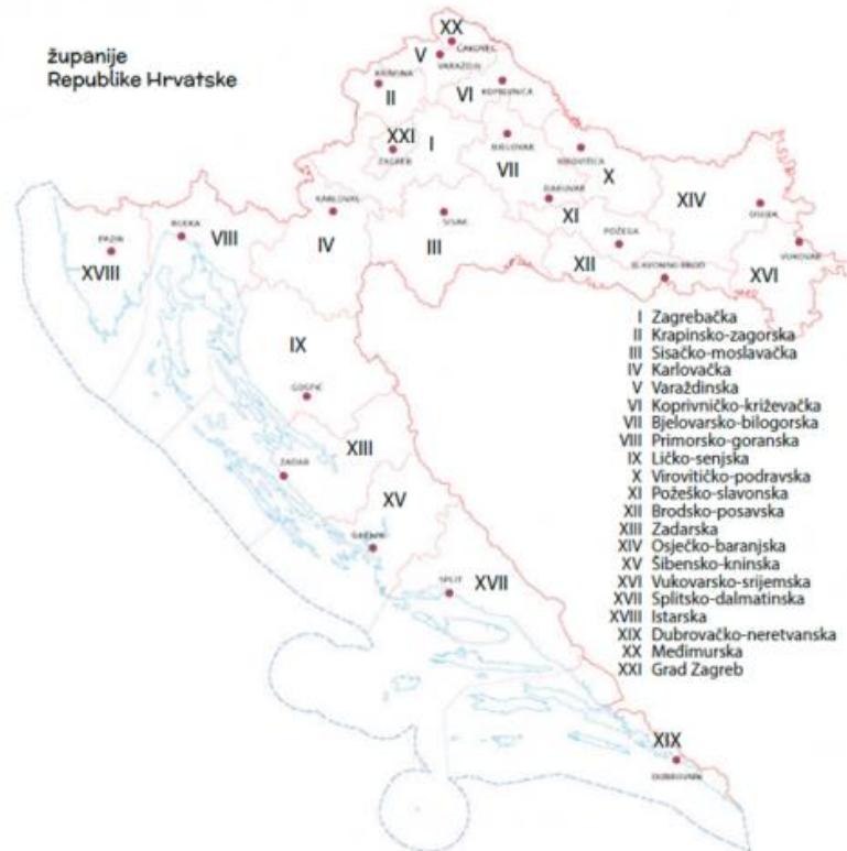
Slika 1 Karta županija Republike Hrvatske

Prema Ustavu RH županija je jedinica regionalne samouprave kojoj je područje prometna, gospodarska, društvena, prirodna cjelina i dr. Županija je teritorijalna i upravna jedinica, a osniva se zbog izvršavanja poslova od regionalnog interesa. Ima predstavničko tijelo koje građani biraju izravno za razdoblje od 4 godine, županijsku skupštinu. Izvršnu vlast u županiji obnašaju župan i zamjenici župana.