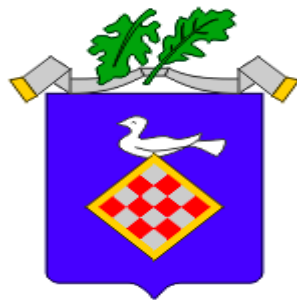
Slika 1. Grb Grada Kutine

Sam Grad Kutina, koji broji 15 000 stanovnika, najveći je moslavački poslovni, trgovački i administrativni centar sa sjedištem mnogih županijskih službi i najvećih moslavačkih poduzeća.