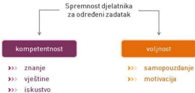
Slika 3 - Spremnost djelatnika na određeni zadatak