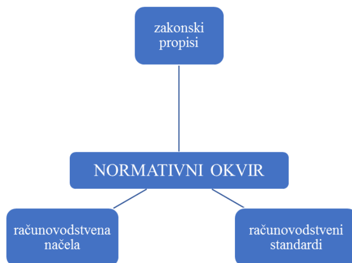
Slika 1. Normativni okvir računovodstva