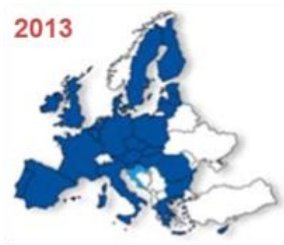
Slika 2. Pristupanje Republike Hrvatske Europskoj uniji