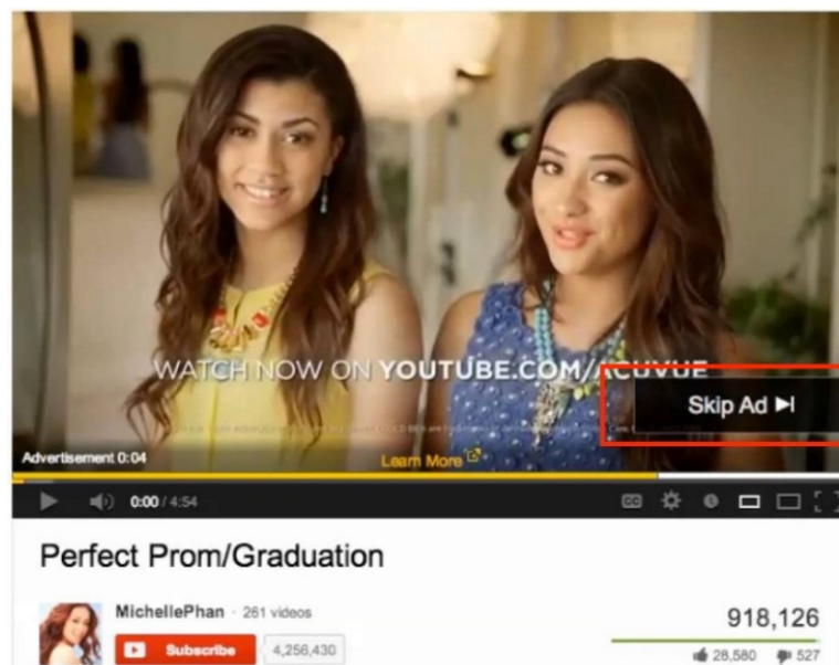
Slika 1 - InStream video oglas; reproduciran prije početka videozapisa

In Stream, takozvani umetnuti oglasi, smješteni su unutar sadržaja u aplikaciji i automatski se reproduciraju kada dosegnu područje aplikacije u kojima su vidljivi svakom korisniku što rezultira velikom stopom vidljivosti. Pojavljuju se putem Youtube-a, Hulu i drugih sličnih web lokacija.