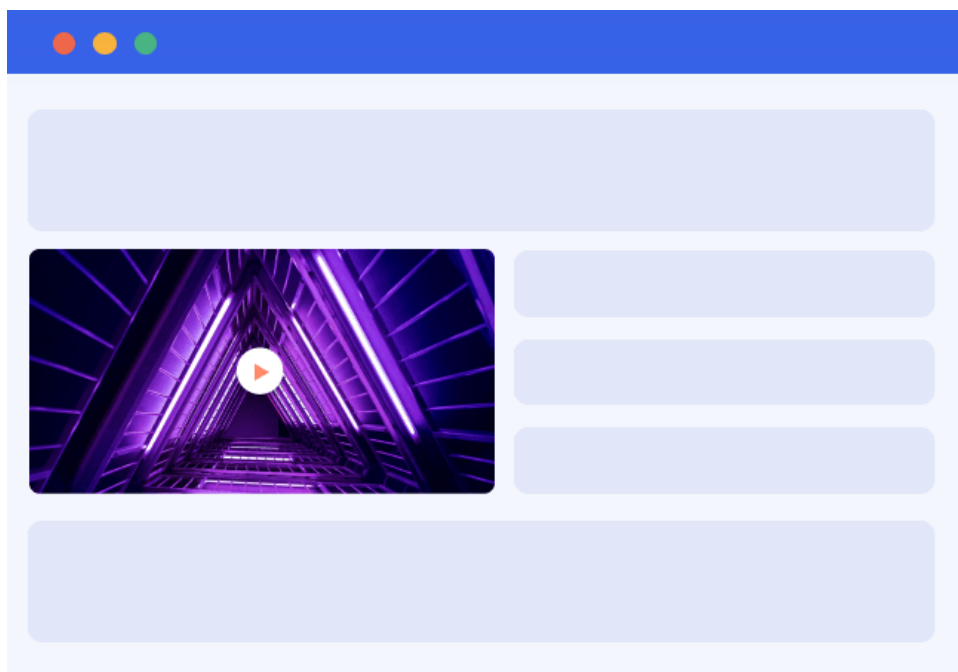
Slika 3 – Umetnuti videooglasi u izvornom sadržaju