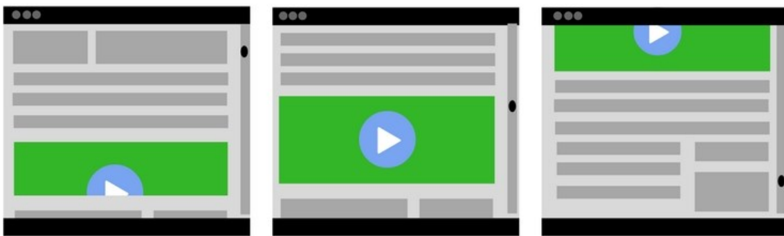
Slika 2 – OutStream video oglas

Oglašavanje putem videozapisa, odnosno outstream videozapisa, karakteriziraju videooglasi koji se pojavljuju u uređivačkom sadržaju koji nije utemeljen na klasičnim videozapisima. Npr., ako se pretražuju digitalne novine poput 24sata, Dnevnik.hr, Večernji list i mnoge druge te se naiđe na video oglase koji se prikazuju kao dio članka koji se čita i započinju se reproducirati. Tzv. vanjski videozapisi predstavljaju oglašavanje proizvoda putem outstream videozapisa.