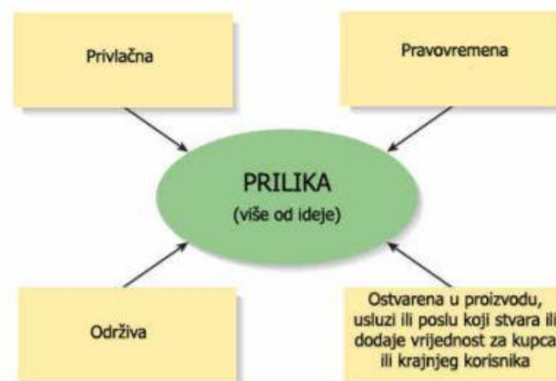
Slika 1 Četiri ključne kvalitativne karakteristike prilike

Slika 1. prokazuje četiri ključne kvalitativne karakteristike prilike: 1. Privlačnost, 2. Pravovremenost, 3. Održivost i 4. Ostvarenje u proizvodu, usluzi ili poslu koji stvara ili dodaje vrijednost za kupca ili krajnjeg korisnika.