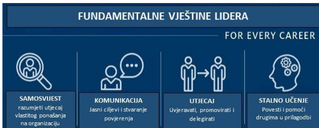
Slika 3 Fundamentalne vještine lidera (Izvor: https://www.ccl.org/articles/leading-effectively-articles/fundamental-4-core-leadership-skills-for-every-career-stage/ (pristupljeno 17. svibnja 2020.))

LIDERSTVO je vještina koja se može definirati na mnogo načina. Jedan od najjednostavnijih načina definiranja ovog pojma je: “Liderstvo je sposobnost razvijanja i prenošenja vizije grupi koja će tu viziju ostvariti.” (Kenneth Valenzuela, 2007).