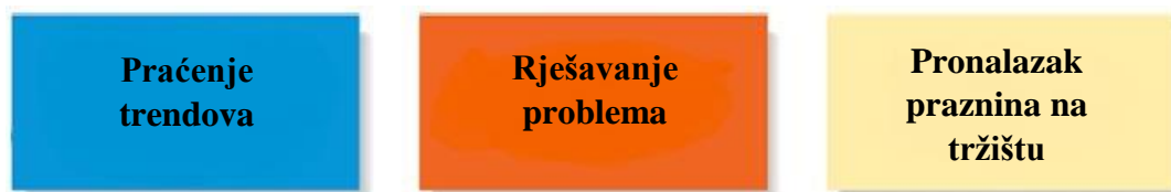
Slika 2 Tri pristupa za identificiranje prilike

preglednike je sazrijelo i prozor prilika se zatvorio. Zato bi danas novom start-up internetskom pregledniku bilo izuzetno teško izboriti udio na tržištu. Barringer i Ireland (2010:44) naglašavaju važnost razlike između prilike i ideje. Ideja je misao koja može, ali ne mora zadovoljavati kriterij za ostvarenje prilike. Navode kako je to vrlo važno jer mnoga poduzetnička ulaganja propadnu i to ne zbog nedovoljnog angažmana vlasnika, već zbog nepostojanja prilike od samog početka. Zato je vrlo važno razumjeti zadovoljava li ideja potrebe i kriterije prilike prije pokretanja i ulaganja u pothvat. Kako bi olakšali nedoumice, poduzetnici koriste tri pristupa opisana slikom br. 2, kojima identificiraju prilike u okruženju: Praćenje trendova, Rješavanje problema i Pronalazak praznina na tržištu.