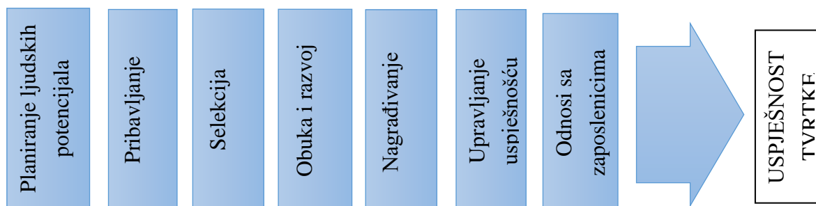
Slika 1. Prakse menadžmenta ljudskih potencijala