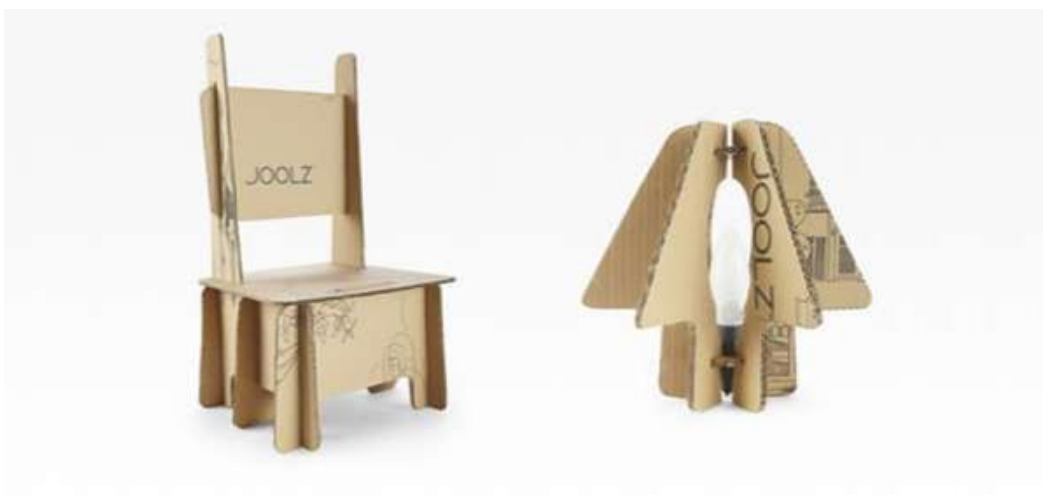
Slika 7: Primjer održive ambalaže tvrtke Joolz

Jedan od dobrih primjera svakako je kompanija za proizvodnju dječjih kolica Joolz. Ona isporučuje svoje proizvode u ambalaži koja sadrži tiskane upute kako pretvoriti karton u razne predmete koji se kasnije mogu koristiti, poput stolica, kućica za ptice ili čak sjenila za lampice. Također, umjesto zasebnog komada papira, tiskane upute se nalaze na kutiji.