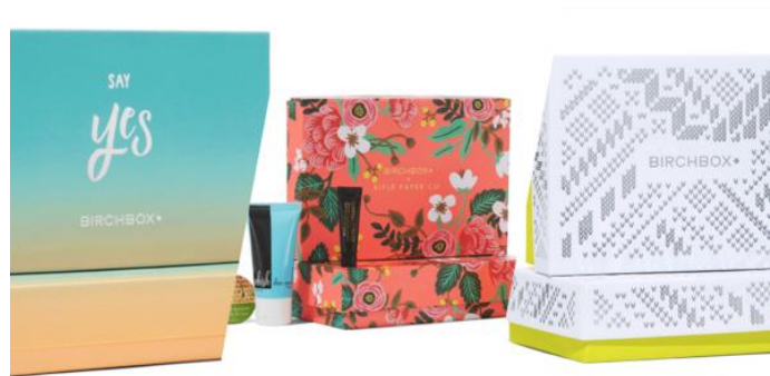
Slika 9: Primjer održive ambalaže tvrtke Birchbox