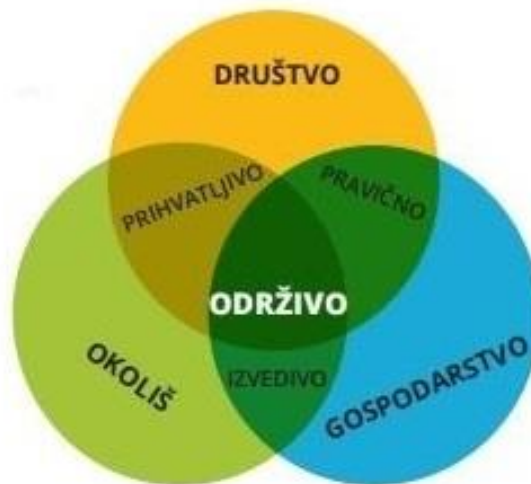
Slika 1: Stupovi održivog razvoja

Cilj održivog razvoja je trojak. On teži gospodarskoj učinkovitosti (ekonomskom razvoju) , društvenoj odgovornosti (socijalnom napretku) i zaštiti okoliša . Tri prethodno navedene stavke se još popularno nazivaju i stupovima održivog razvoja.