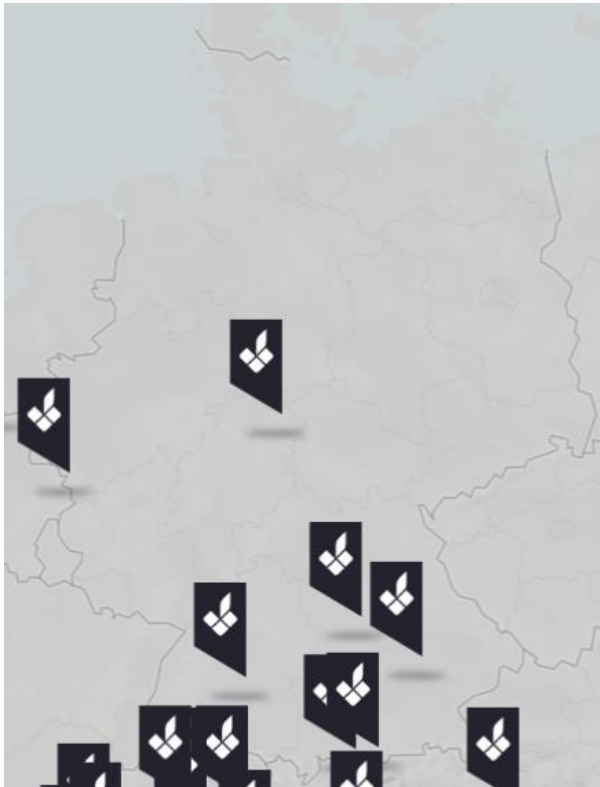
Slika 1: Lokacije bike shopova u Njemačkoj gdje su dostupni Greyp G6.2 električni bicikli

Prema prikazu na Slici 1 može se vidjeti kako je većina bike shopova s Greyp G6.2 biciklima locirana u južnom dijelu Njemačke, točnije u pokrajinama Baden-Württemberg i Bavarska. Ove dvije pokrajine su ujedno i najrazvijenije u Njemačkoj. Za pedalec bicikle poput Greyp G6.2 vrlo je bitno zbog njihove težine i same vrijednosti bicikla da ih se može ostaviti na adekvatnim mjestima. Takva mjesta uključuju određenu infrastrukturu poput punionica i posebnih mjesta za parkiranje bicikala. Sve više gradova i ruralnih mjesta u Njemačkoj ulažu u izgradnju ovakve infrastrukture kako bi se broj korisnika električnih bicikala povećao. Njemačka je vrlo pogodna zemlja koja nastoji svojim inicijativama i projektima poboljšati uvijete za korištenje električnih bicikala. Uz to tehnološko okruženje je vrlo bitno i za samu distribuciju tj. dostavu proizvoda.