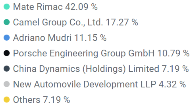
Grafikon 1: Vlasnička struktura u tvrtki Greyp Bikes (Neufund- Greyp Bikes, 2019)