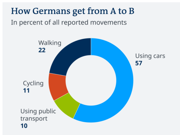
Grafikon 2: Prikaz zastupljenosti korištenja bicikala , Izvor: DW, 2017

Ovakva osviještenost upućuje na određene promjene u vidu korištenja automobila kao glavno prijevozno sredstvo u gradovima i na određenim manjim udaljenostima. Usprkos tomu automobili su i dalje najkorištenije prijevozno sredstvo prema nedavnom istraživanju u Njemačkoj.