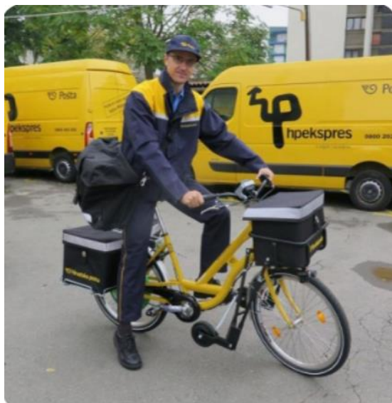
Slika br. 6 Poštar Hrvatske pošte na e-biciklu

Nakon objavljivanja poziva za nadmetanje pristigle su četiri ponude. Ukupna investicija bila je 492.000 eura, od kojih 150.000 eura osigurava Fond za zaštitu okoliša i energetska učinkovitost hrvatske vlade koji subvencionira dio troškova kupnje električnih vozila za pojedince, tvrtke i javne organizacije. U odnosu na trenutno stanje, očekuje se godišnja ušteda od 166.616 eura (1.249.617 hrvatskih Kuna) (otprilike 926 eura po skuteru), a Hrvatska pošta izračunala je kako je otkupna cijena motornih skutera bila oko 1800 eura, e-bicikala između 2.000 i 2.600 eura, a kvalitetnog e-skutera oko 5.500 eura. Godišnji troškovi održavanja 180 skutera s konvencionalnim gorivom su 143.113 eura (1.077.080 kuna), a godišnji troškovi održavanja 180 e-bicikala su 24.000 eura (180.000 kuna). Nadalje, uštedjet će gotovo 47.000 eura na napuštanju motornog goriva s obzirom da će 180 konvencionalnih skutera potrošiti 43.200 litara goriva, a 180 e-bicikala treba 43.875,00 kWh energije. Također, vrijedno je spomenuti i smanjenje razine zagađenja bukom, alternativnom uporabe e-bicikala. Hrvatska pošta zaključila je da su e-bicikli bolje rješenje za njihove potrebe u prijevozu od klasičnih skutera koji imaju domet od 25-40 kilometara dok e-bicikli nude isti domet, no još ih uvijek možete voziti kada im se isprazni baterija. (Europska komisija)