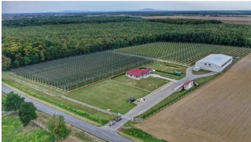
Slika 4 Nasad trešanja OPG Filip Jakob Čolaković

Visina moguće subvencije je 100.000,00 EUR odnosno u kunsjoj protuvrijednosti 746.400,00 kn te pošto se OPG i sam vlasnik vode kao mladi poljoprivrednik, subvencija je zbog toga ograničena na navedeni iznos bez obzira koji je iznos naveden u natječajnoj dokumentaciji. Vlastita sredstva uložena u ovoj mjeri OPG će financirati iz kredita kojemu je rok dospijeca 8 godina. Osim navedenih sredstava OPG je u natječajnoj dokumentaciji priložio i dokumente kojima potvrđuje zapošljavanje dva dodatna radnika.