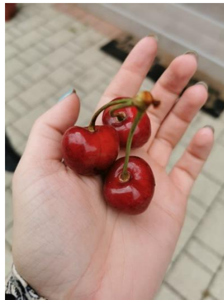
Slika 3 Trešnje OPG Filip Jakob Čolaković

U Hrvatskoj proizvodnja trešanja sve više opada dok u svijetu raste. Razlog toga je nedovoljna educiranost novih i postojećih proizvođača trešanja u najnovije tehnologije uzgoja. Europsko tržište je gladno kvalitetnih trešanja, a koje nije moguće proizvesti bez dodatnih ulaganja u nove tehnologije i modernizaciju postojećih nasada (Očić, 2019:20).