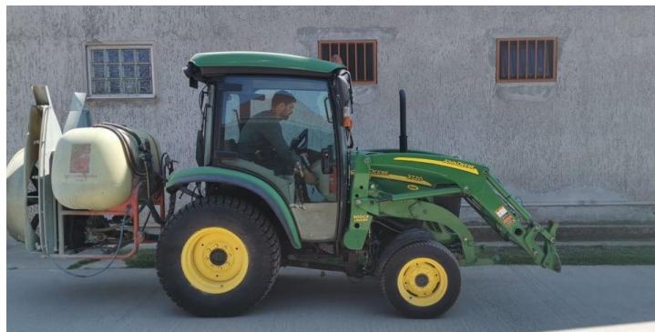
Slika 2 Voćarski traktor John Deere 007 3720 (Privatne slike OPG-a, 2020)

Gospodarstvo posjeduje mali voćarski traktor John Deere 007 3720, stroj za okopavanje sadnica, prskalica Tolmet 1000 L, Felco baterijske škare, voćarska platforma, malčer, meteo stanicu. U sklopu voćnjaka OPG također posjeduje i montažnu kućicu od metalnih panela u kojoj se nalaze dvije prostorije, u jednoj glavni sustav za navodnjavanje i izvodi, a u drugoj ormare u koje se skladište sredstva za zaštitu bilja.