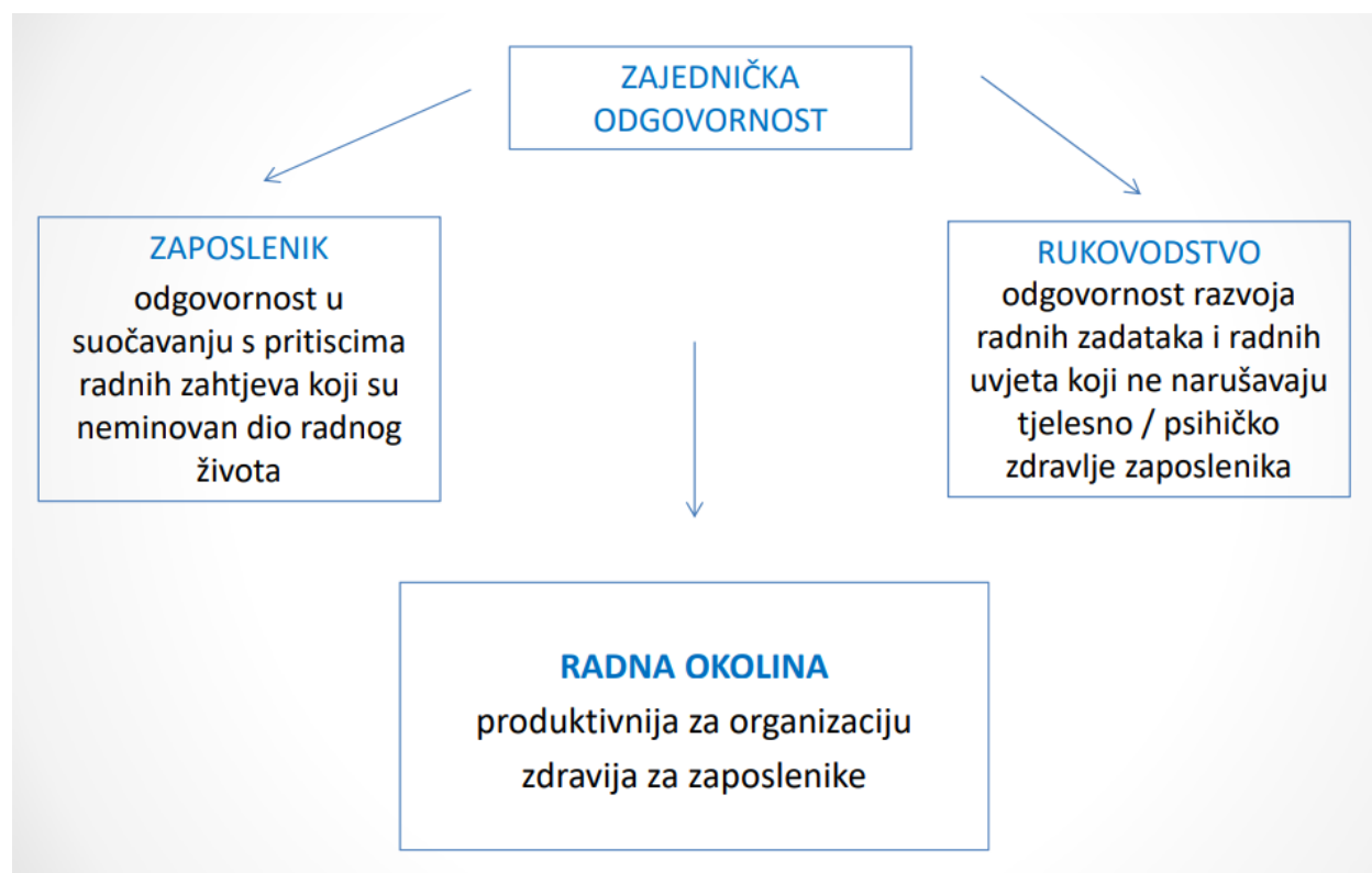
Slika 1. Zajednički pristup upravljanja stresom

Još nešto što se moglo primijetiti je da različiti subjekti mogu i trebaju imati utjecaj na uklanjanje, smanjivanje i prevenciju stresa u organizaciji. Iz tog razloga može se govoriti o tzv. zajedničkoj odgovornosti, odnosno, zajedničkom pristupu u upravljanju stresom. Naredna slika prikazuje osnove zajedničkog pristupa.