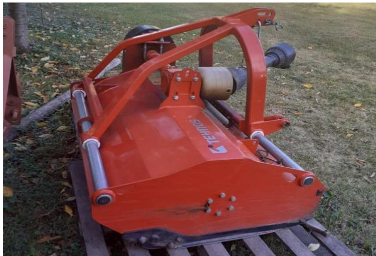
Slika 3 Malčer Tehnos (Privatne slike OPG-a, 2020)