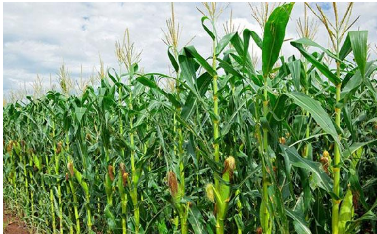
Slika 6 Kukuruz

Rani hibridi su oni koji imaju vegetaciju 90 do 110 dana. Srednje rani hibridi su oni koji imaju vegetaciju 120 do 135 dana, te kasni hibridi su oni koji imaju vegetaciju os 135 do 145 dana. Kukuruz je kao biljka veoma važna kako za ljude tako i za životinje, s obzirom na obujam i raznovrsnost uporabe, nije ni čudno što je jedna on najaktualnijih biljaka kako u Hrvatskoj tako i u svijetu. Veliki ekonomski značaj ima iz razloga sto se gotovo svi dijelovi mogu uporabiti. Danas ima više od 500 vrsta preradevina od kukuruza (razni napitci, kozmetika, lijekovi, kemijski proizvodi i sl.) (Agroklub).