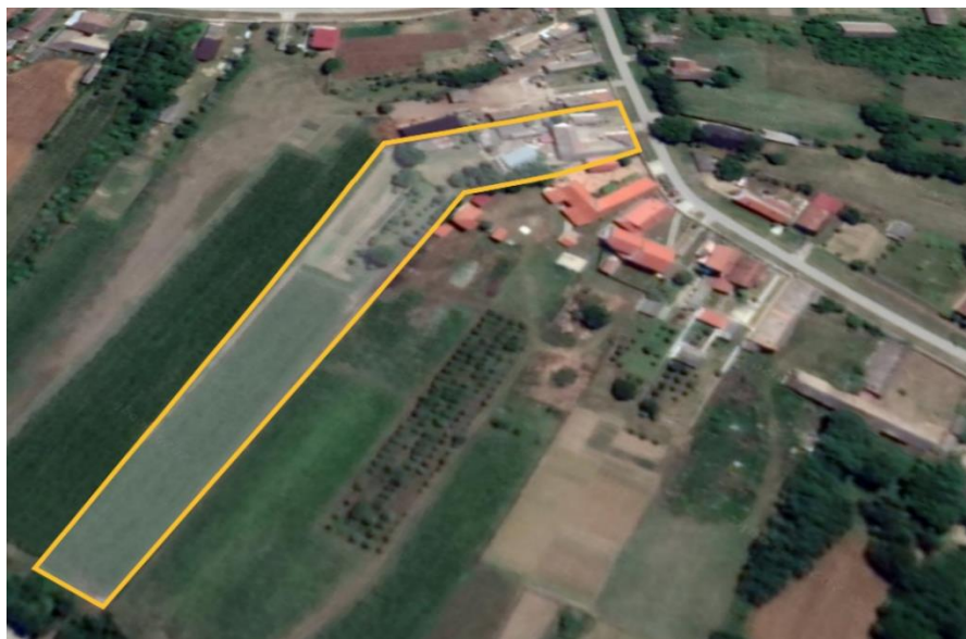
Slika 1 Gospodarsko dvorište i vrt OPG-a Strajnić

Kako bi se što bolje objasnila problematika ekonomike ratarske proizvodnje, odabrano se jedno manje poljoprivredno gospodarstvo koje se nalazi u Osječko-baranjskoj županiji, točnije u ulici Đure Đakovića 23, Popovac. Gospodarstvo ima jednog zaposlenog, koji je ujedno i vlasnik. Povremeno u obavljanju poslova sudjeluje i supruga. Gospodarstvo je upisano u sustav PDV-a, te vodi sva potrebna poslovna knjiženja sukladno Zakonu poreza na dohodak.