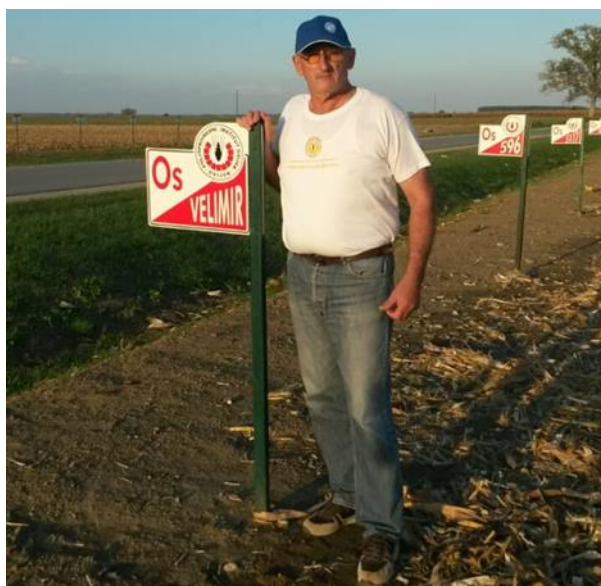
Slika 7 Vlasnik OPG-a Strajnić na oglednom polju