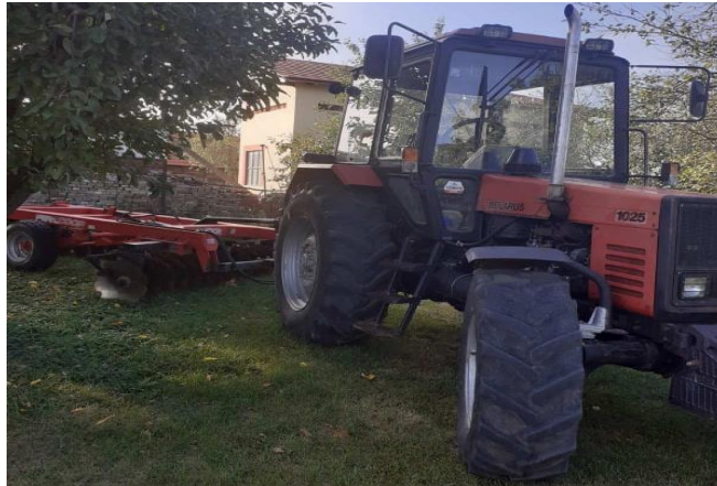
Slika 2 Obiteljski traktor i tanjurača