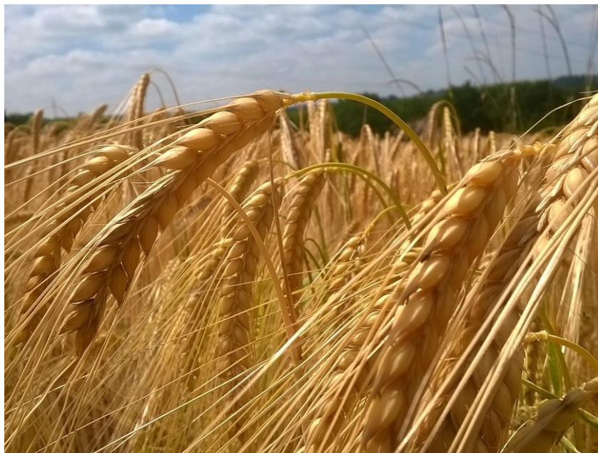
Slika 5 Pšenica

Postoje i razne kategorije vlažnosti i to: suho zrno 14%, srednje suho zrno 14%, vlažno zrno više od 15%, sirovo zrno iznad 17% vlažnosti (Agroklub Hrvatska).