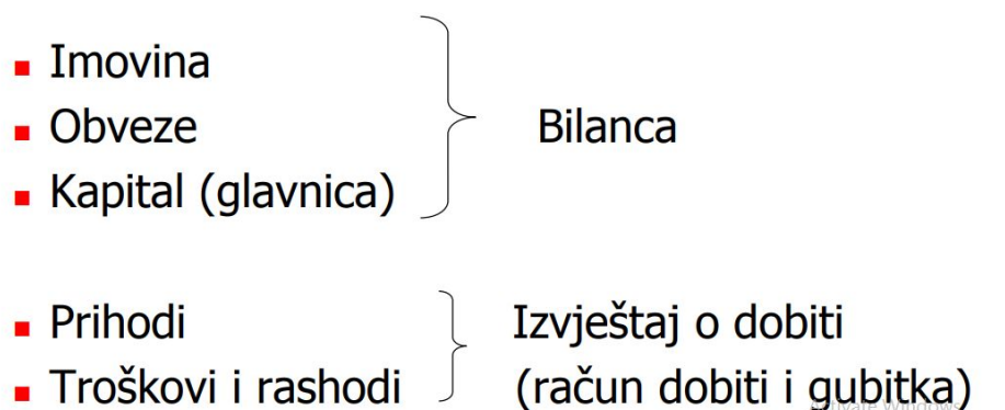
Slika 2.: Financijski izvještaji i elementi financijskih izvještaja (izvor: Dr.sc Hrvoje Perčević, Efzg.unizg prezentacija)

Slika 1. Prikazuje elemente financijskih izvještaja koji se nalaze u neposrednom izravnom odnosu. Pa su tako imovina, kapital i obveze elementi koji su u izravnom odnosu s mjerenjem financijskog položaja u bilanci poduzeća. Elementi koji su u izravnom odnosu s mjerenjem uspješnosti poslovanja poduzeća u računu dobiti i gubitka su prihodi i rashodi. Dok izvještaj o novčanom toku odražava elemente računa dobiti i gubitka kao i promjene elemenata bilance, odnosno novčanih primitaka i izdataka.