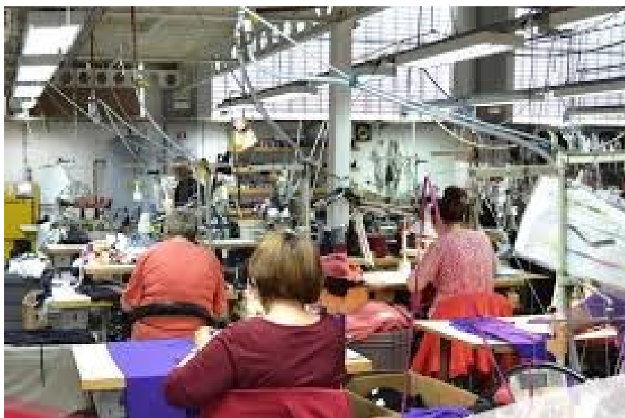
Slika 7: Pogon tvrtke Mako d.o.o.