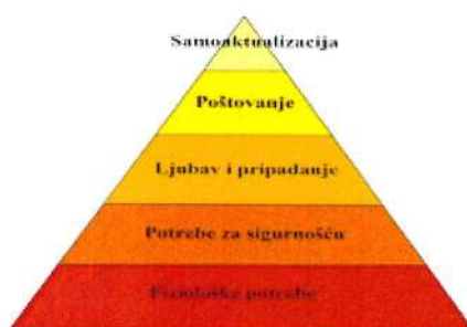
Slika 3.: Teorija potreba

Teoriju hijerarhije potreba – prema ovoj teoriji postoji čvrsta hijerarhija potreba, i tek zadovoljavanjem niže potrebe možemo prijeći na višu razinu potreba. Najpoznatija je Maslowljeva piramida koja potrebe rangira na pet nivoa: egzistencijalne potrebe, potrebe sigurnosti, potrebe pripadanja, potrebe poštovanja i potreba samoaktualizacije.