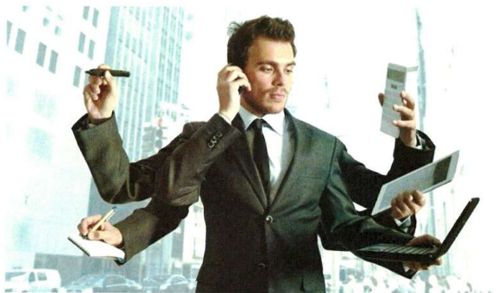
Slika 1.: Menadžer

Sve navedene vještine se stječu obrazovanjem, iskustvom rada i inovacijom znanja. Inovacija razvoja menadžera provodi se u okviru standardnih programa i programa po mjeri. Standardni programi su opće vrijedeći, dok programi po mjeri odnose se na konkretan slučaj. Istraživanja pokazuju da mala poduzeća većinom koriste standardne programe, dok veće kreiraju vlastite programe. 6