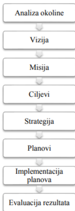
Slika 1. Prikaz procesa planiranja.