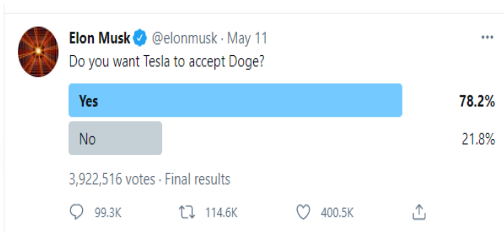
Slika 5: Anketa na Twitter-u