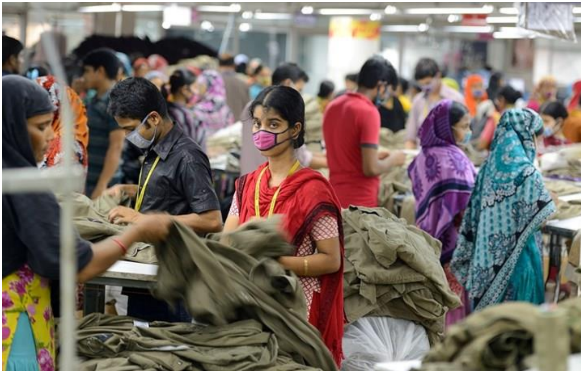
Slika 4: Nike proizvodnja u Bangladešu

tvornicama u Kini i drugim azijskim zemljama u kojima su uvjeti rada loši, plaće male, a postoji i mogućnost dječjeg rada i ropstva. Razlog tome bio je ako to mogu druga poduzeća onda može i Nike. U drugu ruku Nike se promovira kao poduzeće koje brine o sportašima koje sponzorira. Nike na taj način manipulira svoje potrošače koji misle kako se poduzeće prema svojim zaposlenicima odnosi kao i prema osobama koje sponzorira, dok zaposlenici rade u lošim uvjetima i s malom plaćom. Slika u nastavku prikazuje način na koji se proizvode Nike proizvodi.