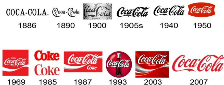
Slika 2. Evolucija Coca-Cola logotipa

Brend nikada nije uistinu konačno gotov. Tijekom vremena se mijenja, razvija i evoluiru poput primjerice logotipa Coca-Cole što se može vidjeti na sljedećoj slici.