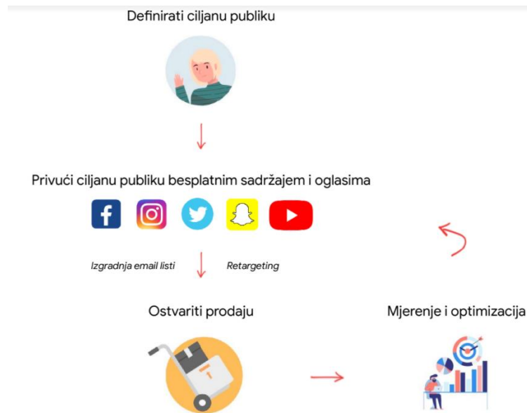
Slika 6. Proces uspješne prodaje

uoči se da je 60% osoba zastalo na istom koraku prilikom odabira načina plaćanja. Iz toga se može zaključiti da problem nije u marketingu na društvenim mrežama, već u samom webu.