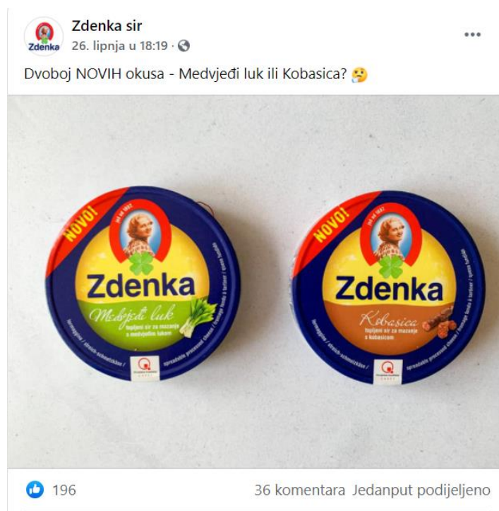
Slika 3. Primjer objave Zdenka sira