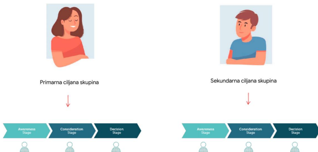
Slika 9. Faze putovanja idealnog kupca

Prema Đerek (2020), putovanje idealnog kupca je proces kroz koji kupci prolaze kako bi postali svjesni o proizvodu ili usluzi, proučili ga te na kraju i kupili.