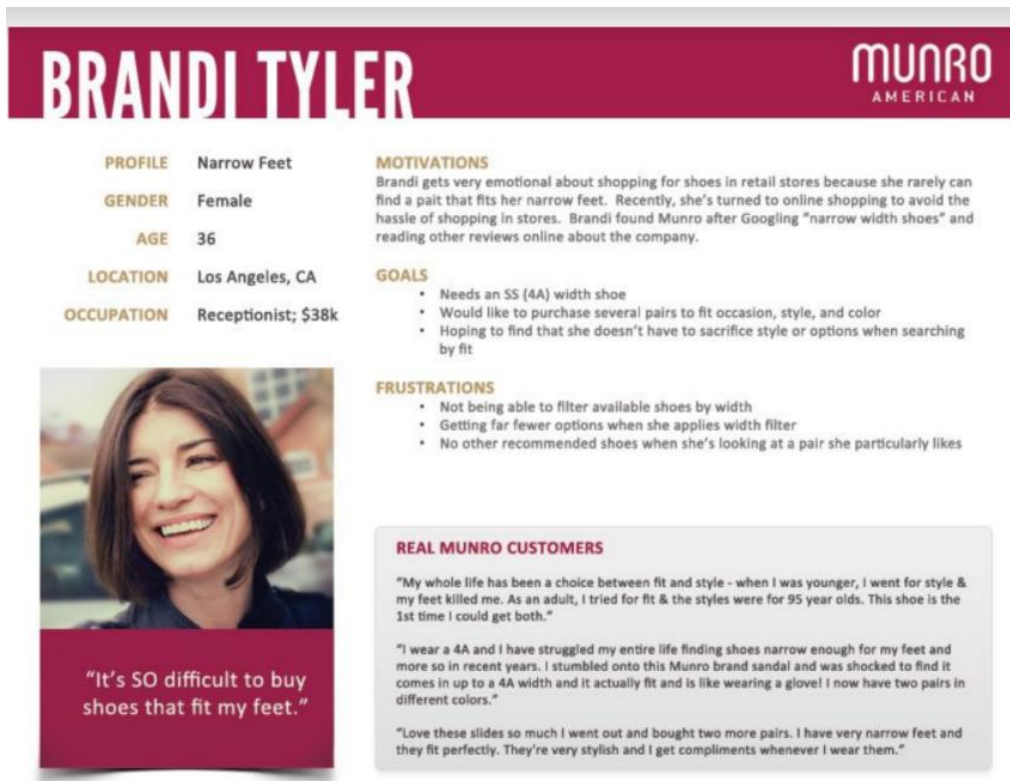
Slika 8. Primjer idealnog kupca