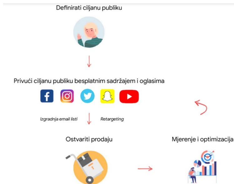
Slika 6. Proces uspješne prodaje

uoči se da je 60% osoba zastalo na istom koraku prilikom odabira načina plaćanja. Iz toga se može zaključiti da problem nije u marketingu na društvenim mrežama, već u samom webu.