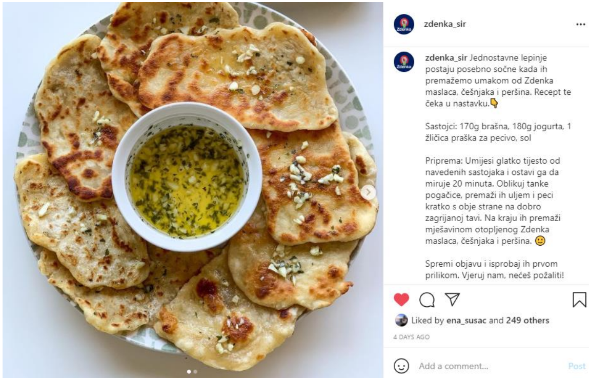
Slika 4. Primjer Zdenka recepta