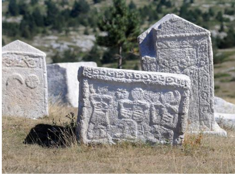
Slika 10.: Stećak 12