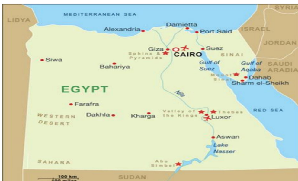
Slika 5 Geografski položaj Egipta