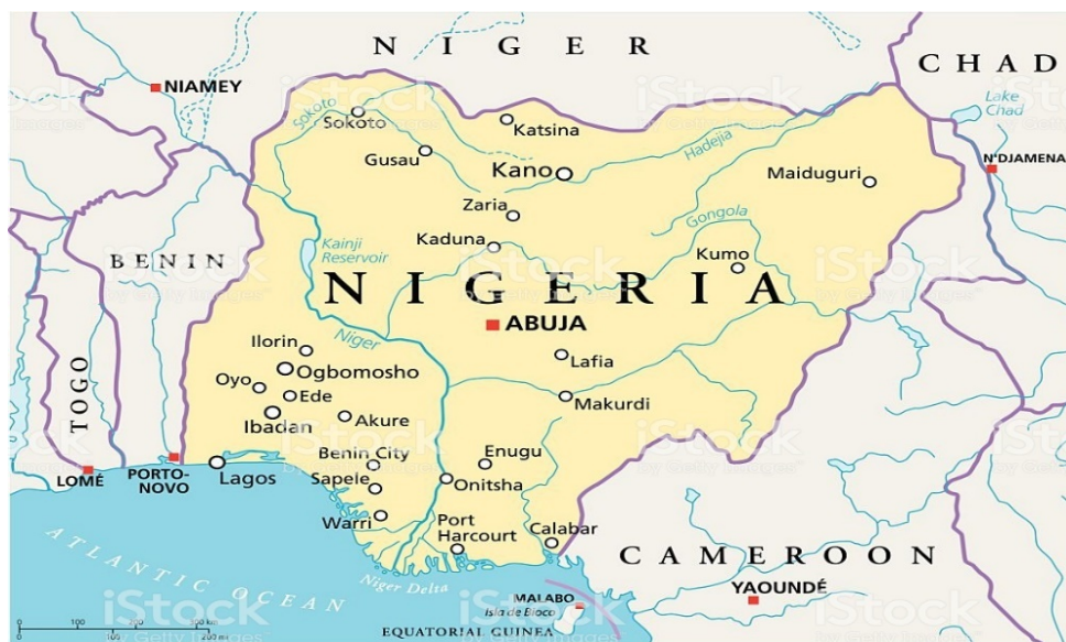
Slika 7 Geografski položaj Nigerije