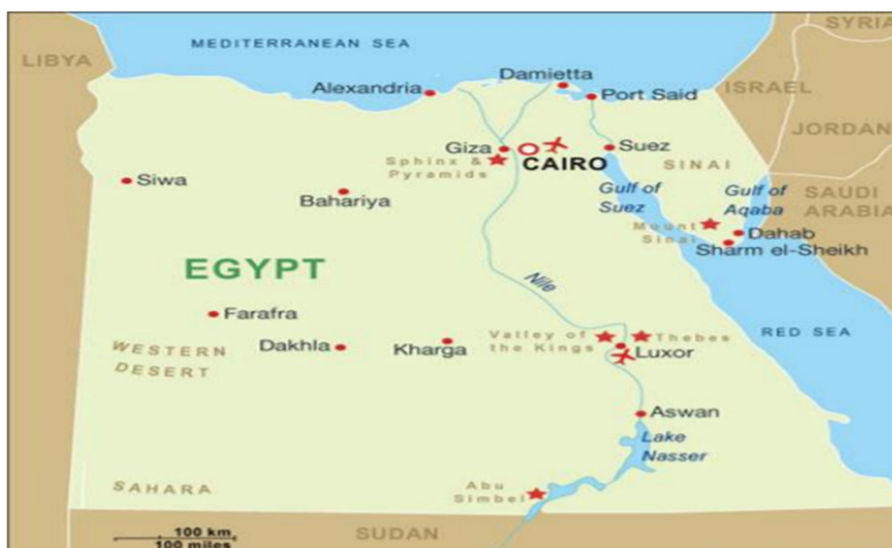
Slika 5 Geografski položaj Egipta