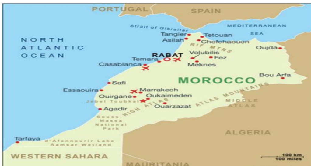
Slika 6 Geografski položaj Maroka