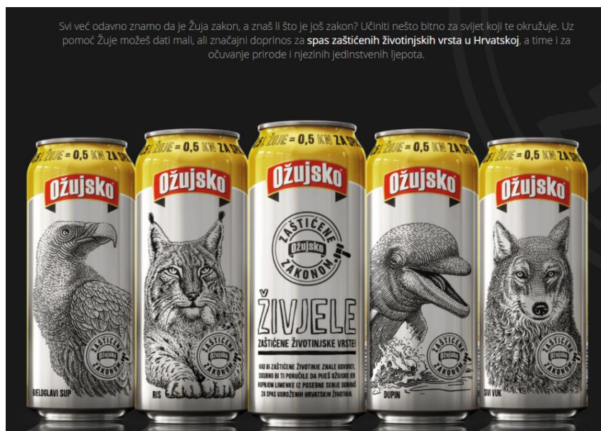
Slika 12. Novi redizajn limenki Ožujskog piva sa skicama zaštićenih životinjskih vrsta u RH

Izvor: Službena stranica Ožujskog piva – zaštićene zakonom: