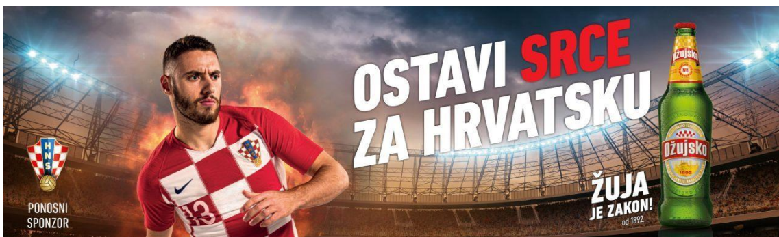
Slika 7. Vizualni identitet kampanje „Ostavi srce za Hrvatsku“ povodom EP-a

Lenta hrvatske šahovnice simbolizira dugogodišnje partnerstvo između Hrvatske nogometne reprezentacije kojoj je Ožujsko službeni sponzor od 1998. godine. Tako je i ove godine Ožujsko pivo, povodom Europskog nogometnog prvenstva kao jedan od partnera reprezentacije, lansiralo kampanju „Ostavi srce za Hrvatsku“ i u sklopu nje televizijski spot i limitiranu seriju limenki čiji su glavni ambasadori hrvatski nogometni reprezentativci Bruno Petković, Nikola Vlašić, Marcelo Brozović i Dominik Livaković (Službena stranica HNS-a).