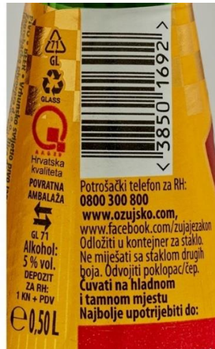
Slika 4. Etiketa Ožujskog piva