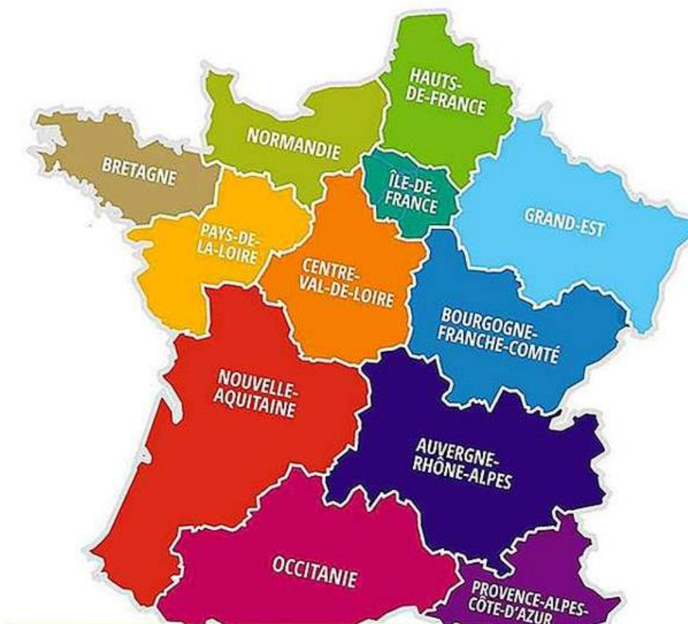
Slika 2. Francuska podjela na regije i departmane

okruža. Do smanjena broja metropolitanskih jedinica došlo je zbog spajanja više njih u jednu (Proleksis enciklopedija 2021.). Slika u nastavku prikazuje podjelu Francuske na regije i departmane.