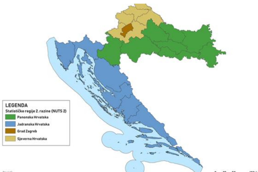
Slika 1. Nova podjela RH na 4 NUTS 2 regije.

Kako je navedeno, slika 1. prikazuje podjelu Republike Hrvatske na četiri NUTS 2 regije. Na slici je vidljivo kako je Hrvatska podijeljena na sljedeće regije: Panonska Hrvatska, Jadranska Hrvatska (dvije najveće regije) te Sjeverna Hrvatska i Grad Zagreb kao posebna NUTS 2 regija.