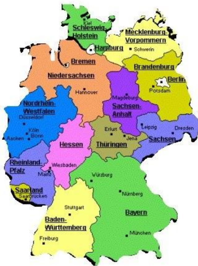
Slika 3. 16 saveznih zemalja Njemačke

središnje države u zemljama OECD -a iznosili su čak 45,8%. Što se tiče broja zaposlenih, samo 10% od ukupnog broja zaposlenih u njemačkoj javnoj upravi zaposleno je u saveznoj vladi. To jasno pokazuje da je vlada niže razine vlada koja učinkovito pruža usluge građanima. Kao dodatni dokaz, dovoljno je pokazati da se 75% saveznog i državnog zakonodavstva provodi na lokalnoj razini, kao i zakonodavstvo EU "(Manojlović, 2015.). Sljedeća slika prikazuje podjelu Njemačke na savezne države.