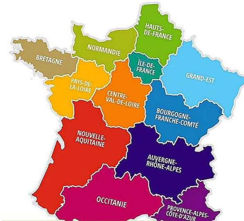
Slika 2. Francuska podjela na regije i departmane

okruža. Do smanjena broja metropolitanskih jedinica došlo je zbog spajanja više njih u jednu (Proleksis enciklopedija 2021.). Slika u nastavku prikazuje podjelu Francuske na regije i departmane.