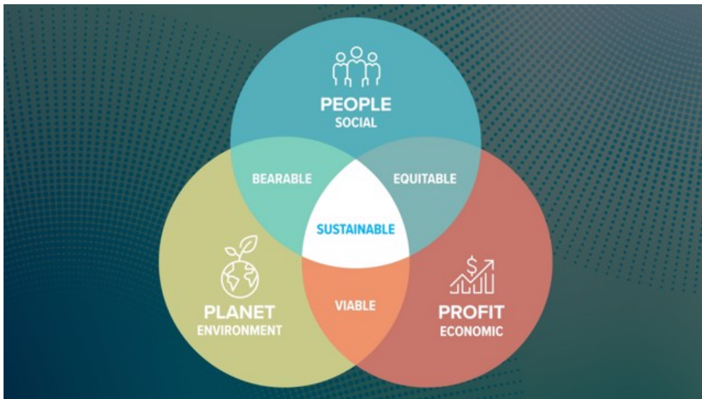
Slika 2 Trostruki rezultat DOP-a (Triple bottom line)

Održivi razvoj korporacije postižu ukoliko su sve tri dimenzije u ravnoteži i međusobno se preklapaju.