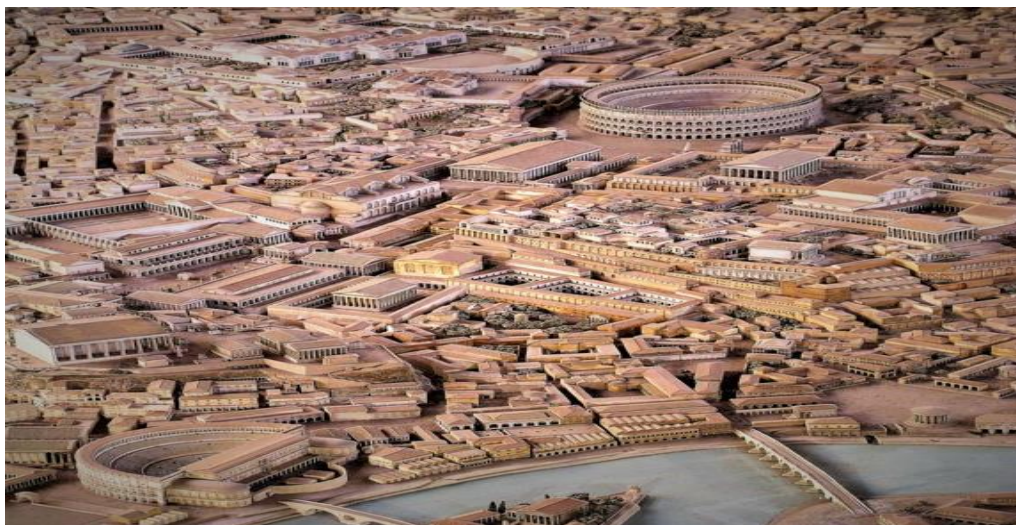
Slika 2: Izgled povijesnog Rima