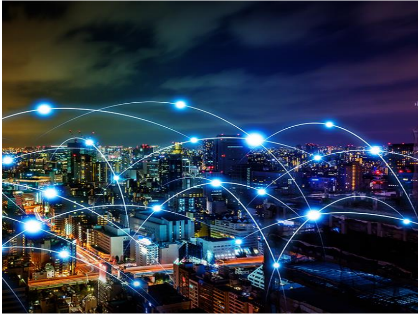
Slika 6: Izgled pametnog grada

zdravstvo, opskrba energijom i energetska održivost, opskrba vodom, gospodarenje otpadom, gospodarski razvoj i stanovanje, te angažman građana i gradske zajednice (europa.eu)