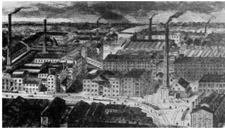
Slika 4: Izgled industrijskog grada

milijun stanovnika, a London je, kao najveći europski grad s 2,3 milijuna (1850.godine) zabilježio porast na 7,3 milijuna (1910. godine). Osim industrijskih gradova značajan porast broja stanovnika doživjeli su i lučki gradovi. Oni su služili za izvoz industrijskih proizvoda i uvoza sirovina. Neki od tih gradova su London, Pariz, Lisabon, Berlin, Rim, Madrid, Amsterdam. Ono što je dalo veliki poticaj za razvoj gradova bila je izgradnja željeznice. Gradovi su spajanjem na željezničku mrežu nastavili sa razvojem. Uz željeznicu velikom napretku u razvoju urbanih sredina potpomogao je i razvoj električne energije i proces elektrifikacije tijekom 20. stoljeća.