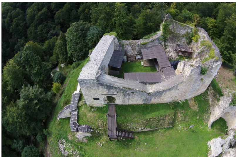
Slika 3: Izgled srednjovjekovnog grada (Burga)

pripadnici zajednice su dobili svoje mjesto u njemu, a vladajući slojevi, preuzeli su odgovornost kako bi zaštitili svoje podređene i državu u kojoj žive. Od 10. stoljeća započinje jači razvoj poljoprivrede kao ključne gospodarske djelatnosti. Kako se povećala poljoprivredna proizvodnja, započelo je proširivanje poljoprivrednih površina. Tako je došlo do pojave značajnijih poljoprivrednih viškova koji postaju predmet razmjene (trgovine). Tako dolazi do ponovnih oživljavanja trgovine i razvoja trgovačke klase. Gradovi su postali najpogodnija mjesta za trgovinu (ili veća ruralna naselja koja su uskoro preoblikovana u gradove). Gradovi su osim mjesta za trgovinu postala i središta proizvodnje. Zbog tih djelatnosti nastaje velik broj novih gradova.