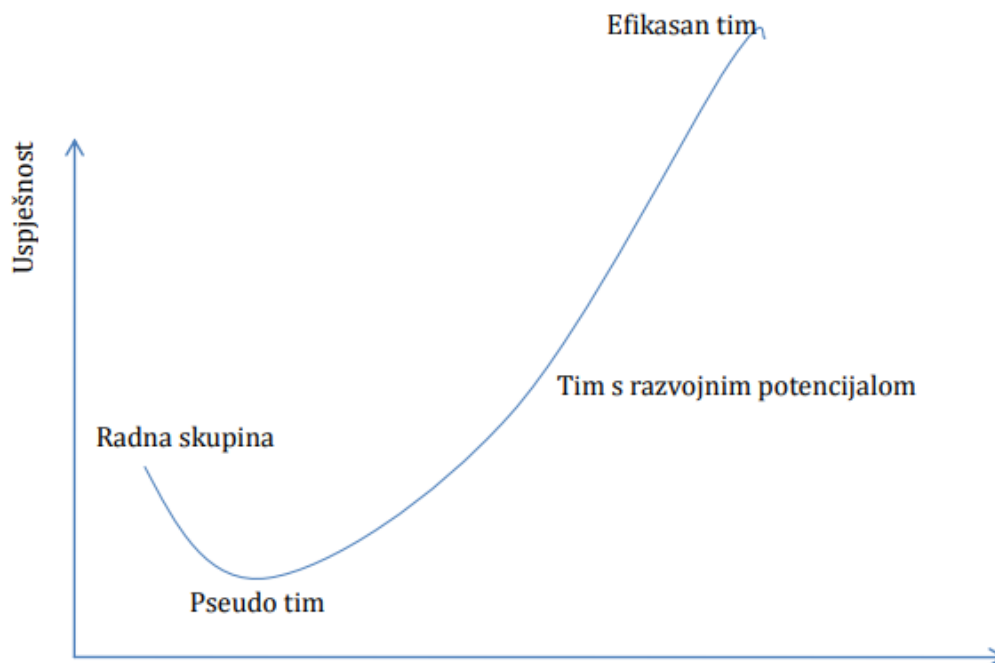
Slika 1.: Evolucija timskog rada

prihvatljivost međuljudskih odnosa, tj. kompatibilnost osobnosti članova tima. U fazi traženja i preispitivanja dolazi do sukoba – osporavaju se uloge koje su neki članovi tima preuzeli i/ili izbor vođe. Ovo je najizazovnija faza upravo zbog potrošenog početnog entuzijazma – timovi ne uspijevaju uvijek proći ovu fazu, nego se dio članova odvaja ili trajno odlazi. Ovu fazu karakterizira i pritisak zadataka koje tim treba obaviti, teško držanje koraka s postavljenim rokovima, stoga se jednostavnije čini držati se okvira i uobičajenih procedura poslovanja. U fazi normiranja stvara se grupna kohezija, članovi tima prihvaćaju svoju i tuđe uloge u timu, međusobno se podupiru, razvijaju grupnu odgovornost i kooperativnost. U četvrtoj fazi tim je efikasan, orijentiran na ispunjavanje ciljeva i rješavanje stvarnih problema. Slika 1. prikazuje evoluciju timskog rada.