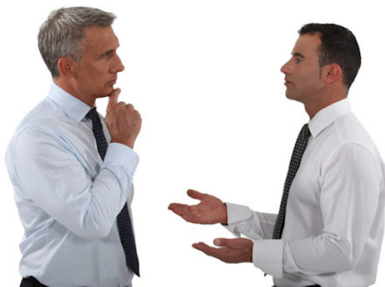
Slika 2. Verbalna komunikacija