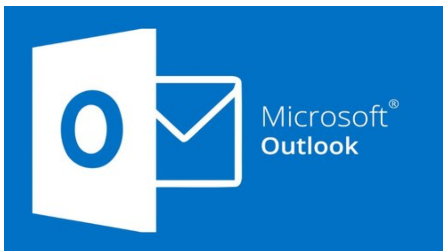
Slika 9. Najčešće korišten e-mail servis u poslovnom svijetu