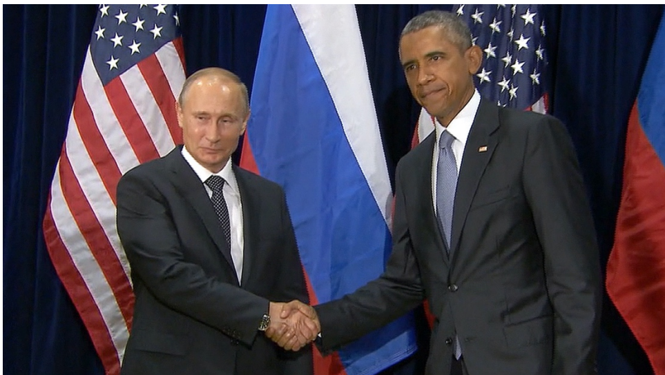
Slika 7. Rukovanje-najčešći oblik dodira između ljudi