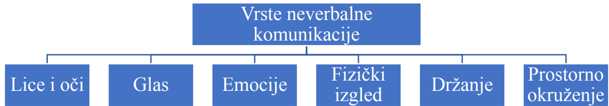
Slika 4. Vrste neverbalne komunikacije