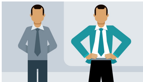
Slika 5. Stav tijela