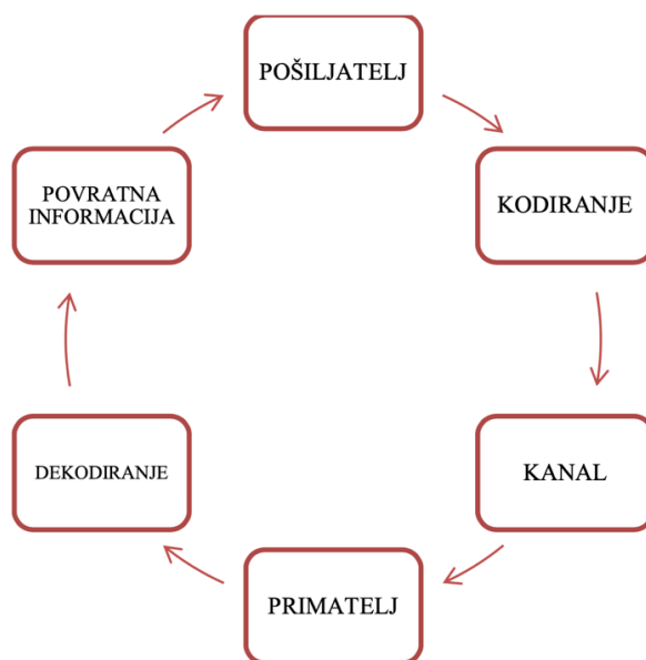
Slika 1. Proces komunikacije

Model komunikacije zahtijeva sudjelovanje najmanje dvije osobe. Proces komunikacije, koji je vidljiv na slici 1, strukturiran je na način da sudionici odašilju poruku ( kodiranje poruke ) preko komunikacijskog kanala drugim sudionicima koji primaju poruku ( dekodiranjem tj. interpretacijom poruke), te povratnom vezom ( feedback ) zatvaraju komunikacijski proces. (Glavaš, Lamza-Maronić 2008:21)