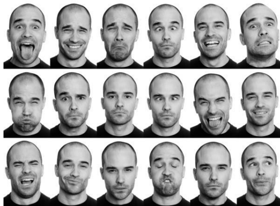
Slika 6. Emocije lica