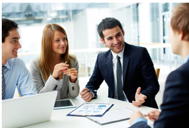
Slika 3. Komuniciranje za vrijeme sastanka