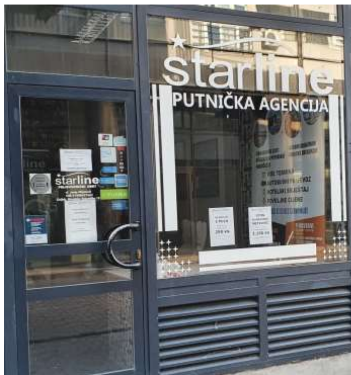
Slika 4: Poslovnica Starline putničke agencije

Fizička lokacija se nalazi u centru grada Osijeka. Iako u centru grada, poslovnica se nalazi u sporednoj ulici koja nije osobito prometna. Prostor unutar poslovnice je uređen promotivnim plakatima, slikama sa prošlih putovanja te dezenom koji asocira na putovanja kao što su krajolici, svjetske znamenitosti i slično. Zaposlenici agencije su iznimno susretljivi i otvoreni za pitanja o putovanjima, uvjetima putovanja, ali i o samoj agenciji.