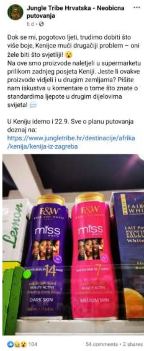
Slika 3: Facebook objava turističke agencije Jungle Tribe

poticanje na stvaranje korisnički generiranog sadržaja. Tijekom putovanja se mogu dogoditi zanimljive situacije koje će postati okidač za promociju i interakciju korisnika na društvenim mrežama, jednu takvu prikazuje slika 2 koja opisuje ono što je u Europi nezamislivo. Regionalna turistička agencija Jungle Tribe na svom Facebook profilu podijelila je zanimljivu sliku sa putovanja u Keniju koje su oni organizirali, Slika je potaknula pratitelje agencije na društvenim mrežama da likeaju te u komentarima iznesu svoje mišljenje ili tagiraju svoje prijatelje kako bi i oni vidjeli objavu. U objavi se također navodi datum idućeg putovanja u Keniju te direktna poveznica na web-stranicu na kojoj se može kupiti usluga.