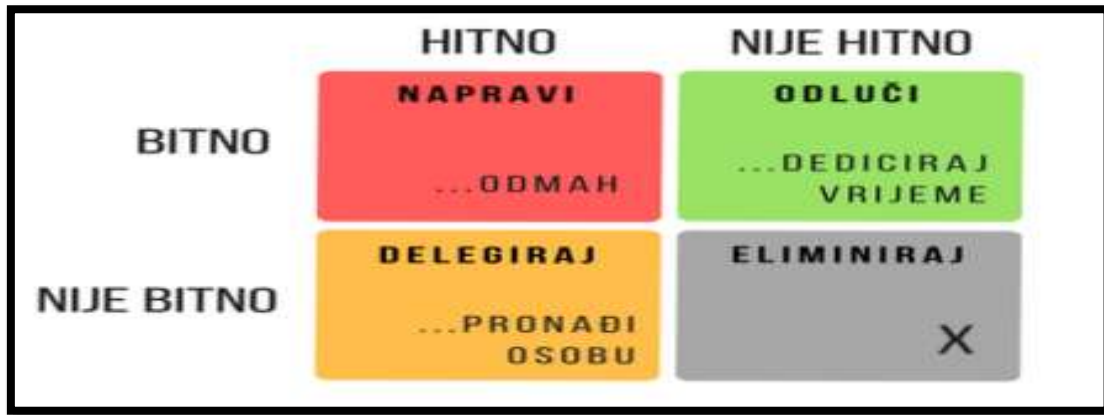
Slika 2. Matrica HITNO/BITNO

Bitno je analizirati svoje ciljeve kroz ove kategorije kako se ne bi dopustilo da stvari nižeg prioriteta ugroze stvari višeg prioriteta. Kada se govori o aktivnostima njih možemo podijeliti u koordinati hitnosti i bitnosti.