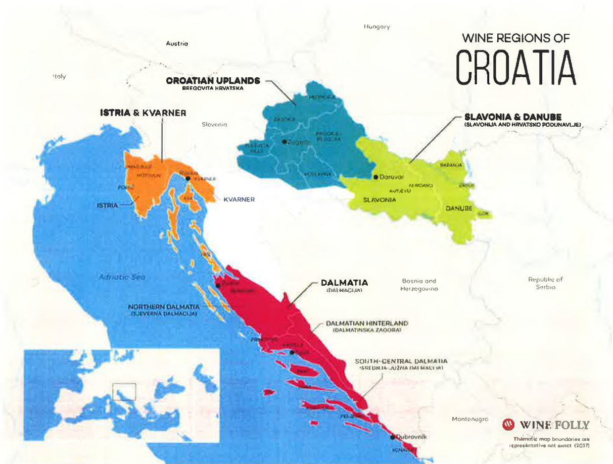
Slika 3. Vinske regije u Hrvatskoj

Turističko putovanje kroz vinski turizam podrazumijeva posjetu vinarijama, vinogradima, izložbama vina, pri čemu degustacija vina ima primarnu motivaciju.