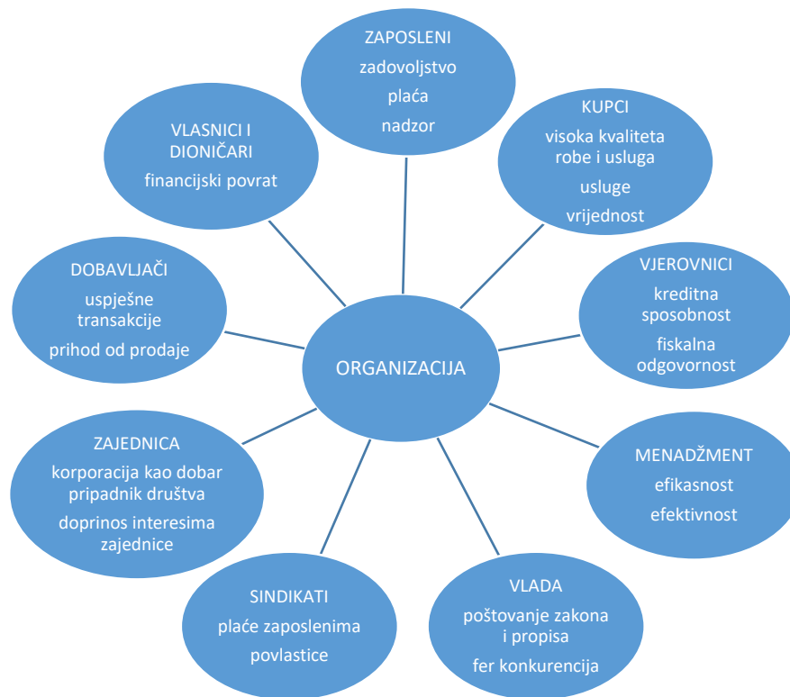
Slika 1. Glavne interesno utjecajne skupine i njihova očekivanja