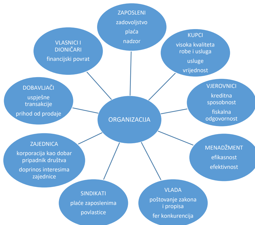
Slika 1. Glavne interesno utjecajne skupine i njihova očekivanja