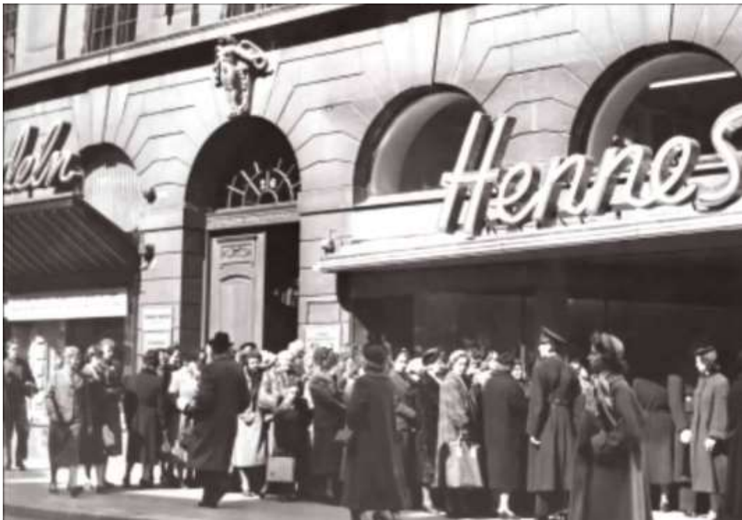
Slika 1. Prva poslovnica današnjeg H&M-a, 1947, Švedska

Prva poslovnica današnje multinacionalne kompanije H&M prikazana je na Slici 1.