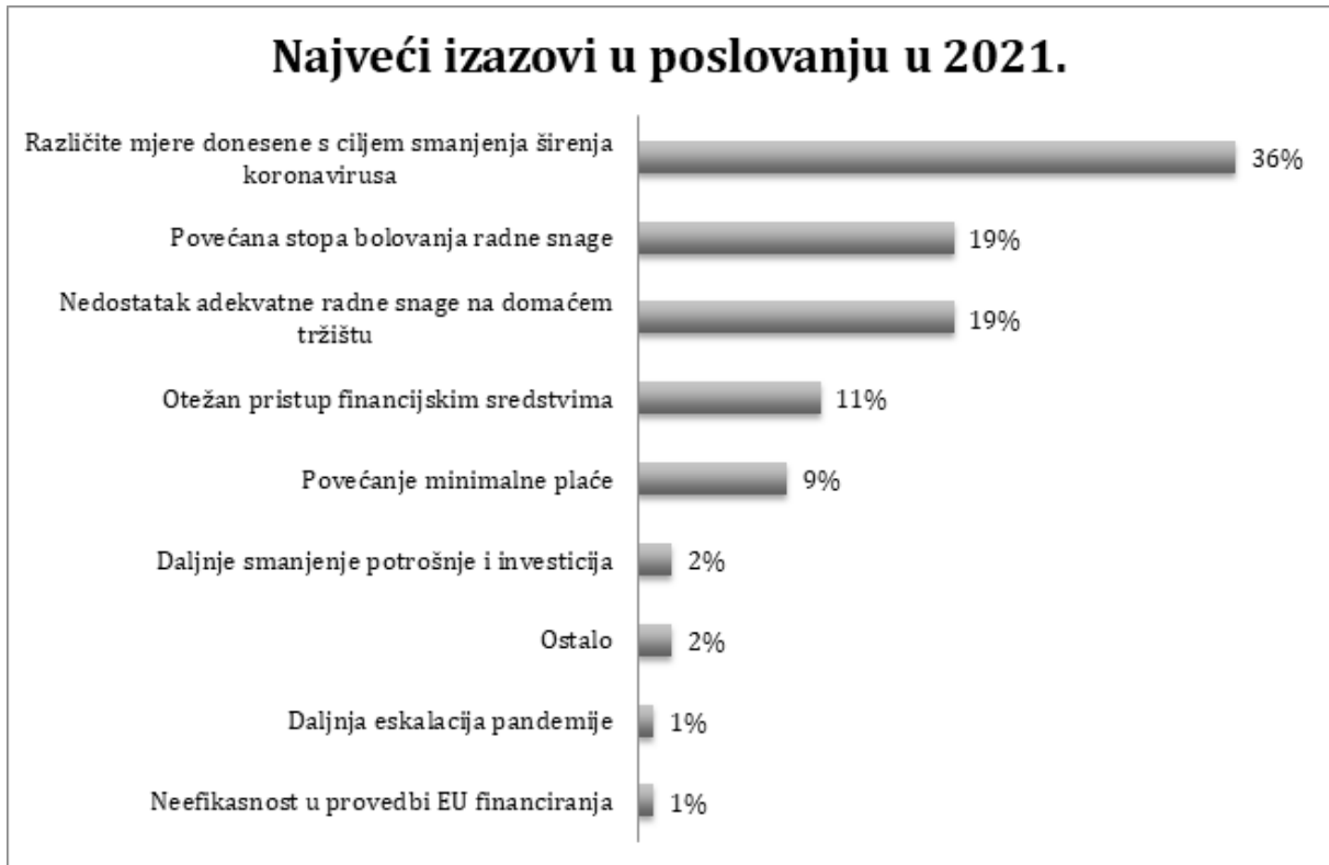
Grafikon 1: Najveći izazovi u poslovanju u 2021.