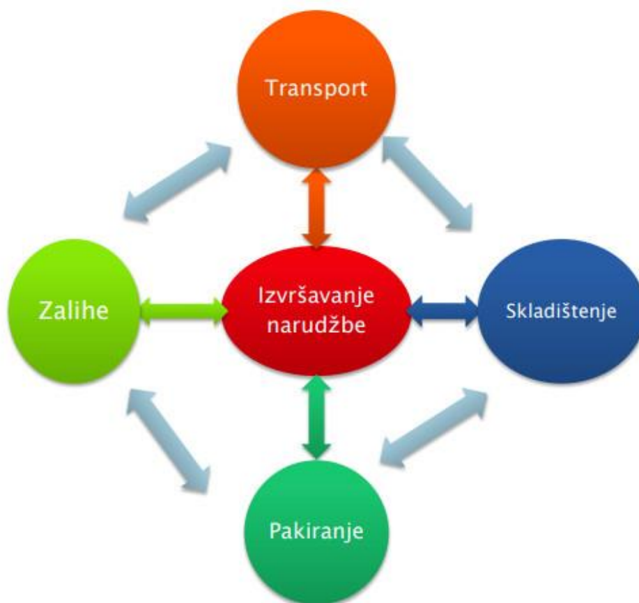
Slika 1. Elementi logističkog sustava (Dujak, 2020)