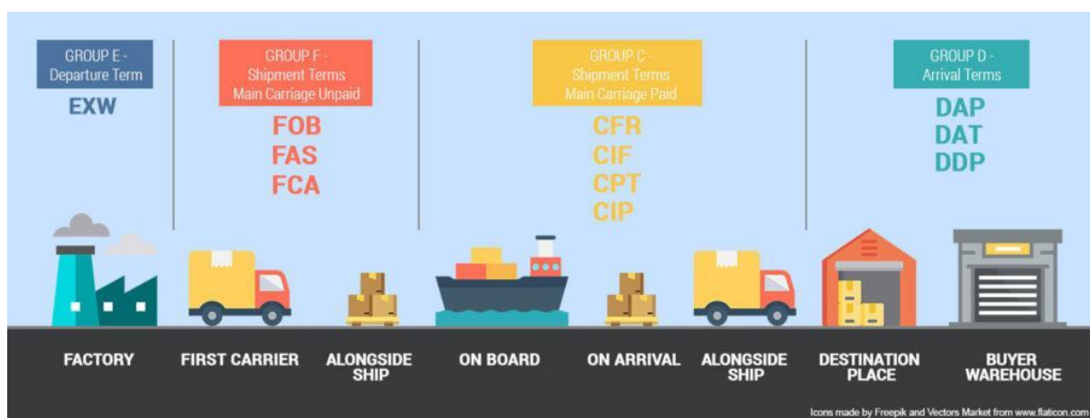
Slika 1.: Podjela INCOTERMS® pravila po glavnim grupama

Shipment term main Carriage paid , hrv. termin rok i glavni prijevoz plaćen) i Grupa D (engl. Arrival Terms hrv. uvjeti dolaska). ( https://fbabee.com/incoterms/ ) Svaku osnovnu grupu čine INCOTERMS® pravila po kojima se definiraju odgovornosti pri sklapanju ugovora o kupoprodaji, obveze prodavatelja i kupca, te troškove prijevoza između prodavatelja i kupca. Koje će se pravilo INCOTERMS® primijeniti, ovisi o sklopljenom kupoprodajnom ugovoru između prodavatelja i kupca, vrsti i načinu prijevoza. Ukoliko nastane šteta, njihovom pravilnom primjenom može se utvrditi točka prijenosa rizika s prodavatelja na kupca ili s kupca na prodavatelja, odnosno tko će snositi troškove štete. Na slici 1. prikazana je podjela INCOTERMS® pravila po glavnim grupama. (ICC,2019.)