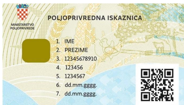
Slika 4: Poljoprivredna iskaznica

Upis u Upisnik obiteljskih poljoprivrednih gospodarstava obavezan je za poljoprivredna gospodarstva koja traže tj. koja su podnijela zahtjev za poticaj, te za obiteljska gospodarstva koja na tržištu prodaju vlastite poljoprivredne proizvode, što znači da ona poljoprivredna gospodarstva koja nisu upisana u Upisnik nemaju pravo na državne poticaje kao ni na prodaju vlastitih poljoprivrednih proizvoda (Narodne novine, Pravilnik o Upisniku obiteljskih poljoprivrednih gospodarstava ( NN 62/2019 ), 2019).