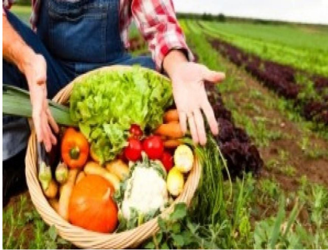
Slika 2: Ekološka proizvodnja hrane

Zdrava odnosno ekološka hrana može se proizvesti i u industrijskoj tj. intenzivnoj proizvodnji ali samo po strogim ekološkim uvjetima odnosno kriterijima jer ekološki proizvodi kako je ranije navedeno su proizvodi koji nisu tretirani kemikalijama i umjetnim gnojivima koji potiču rast usjeva (Cifrić I., 2002).