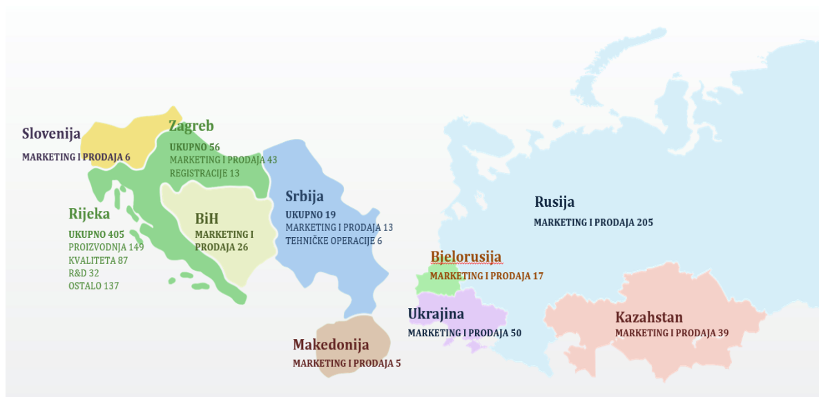
Slika 1. Struktura zaposlenika u 2020. godini po tržištima i ključnim područjima rada